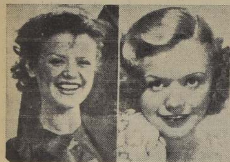
Esta jovencita despiada, como un perrito púgiles, es también, esta hermosa joven que conocemos en la pantalla, y que se llama Simone Simon.