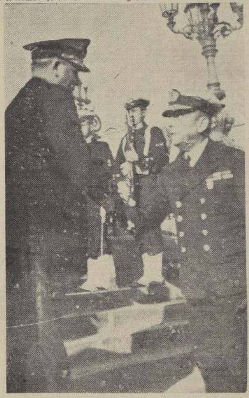
El Director General de la Armada, almirante Reyes del Río, saludó al contraalmirante Repetto.