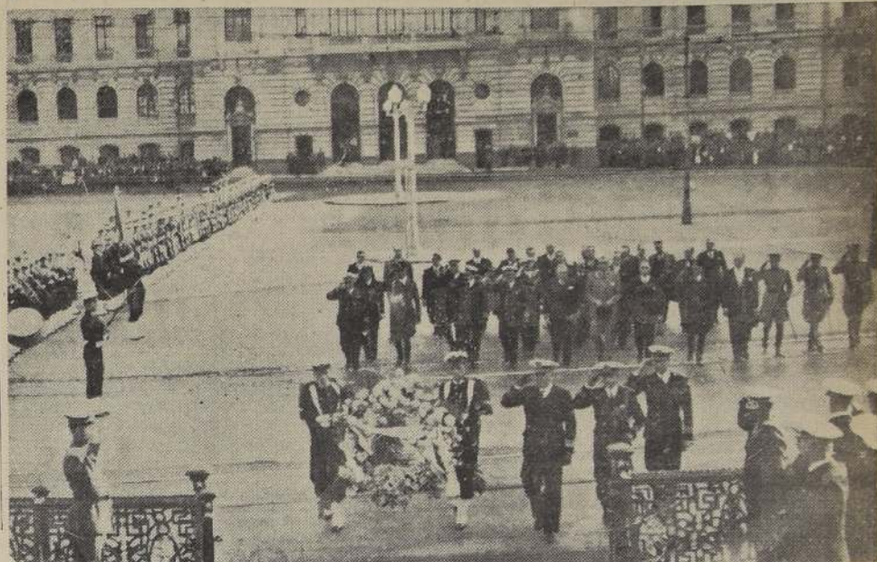
Durante el homenaje de la Armada argentina a los Héroes de Iquique

En la noche del lunes, cuando el Excmo. señor Alessandri ofreció en la Moneda un gran banquete en honor del doctor Cantilo, hizo entrega al Canciller argentino de la Gran Cruz de la Orden "Al Merito". En esta oportunidad S. E. el Presidente de la República pronunció las siguientes palabras: "Excmo. señor: El padre de la patria, don Bernardo O'Higgins que remonta las más altas cumbres de los Andes al lado de San Martín, para venir a darnos patria y libertad, estableció la ORDEN AL MERITO para honrar a los extranjeros ilustres o que hubieran prestado servicios o manifestado simpatía a nuestro país. Nunca las finalidades que tuvo en vista el Padre de la Patria al crear esta insignia se cumplen mejor que hoy cuando me permito otorgarles como símbolo de la fraternidad de nuestros dos pueblos y manifestación