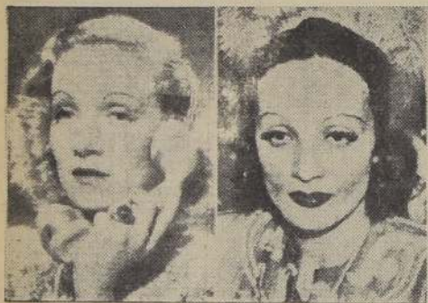
Marlene Dietrich, maquillada, obtiene esta expresión ideal, que, por supuesto no es la misma de la realidad, cuando sale de un teatro.