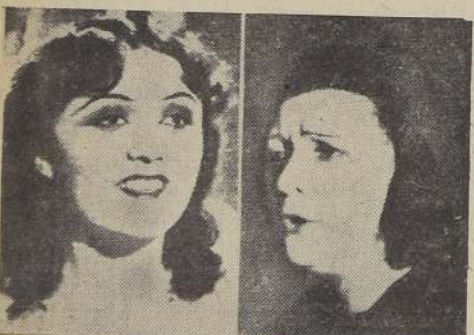
Y luego, ¿reconocerá usted a Pola Negri, en la foto de la derecha? Por ella se batieron muchos hombres. En el cine era hermosa...