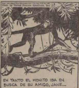
EN TANTO EL MONITO IBA EN BUSCA DE SU AMIGO, JANE...