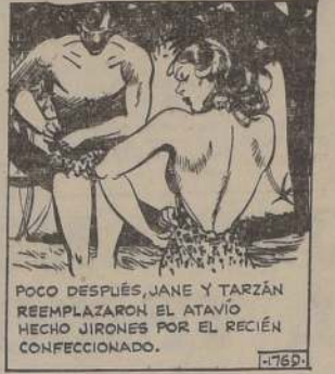
AL LLEGAR, IMPRESIONADO POR EL CAMBIO DE ROPA, EL MONITO OLVIDÓ UNA VEZ MÁS LA RAZÓN DE SU PÁNICO.