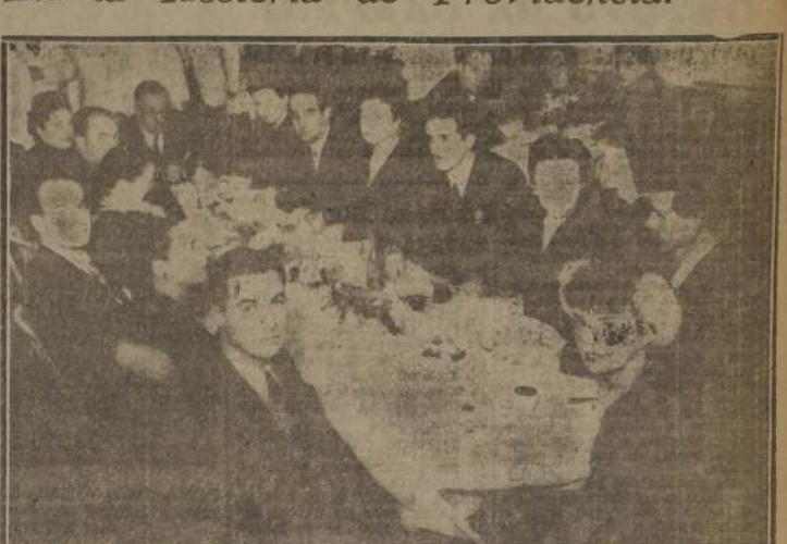
Aspecto del comedor de la Hosteria de Providencia, en la que se da cita, noche a noche, una distinguida concurrencia.