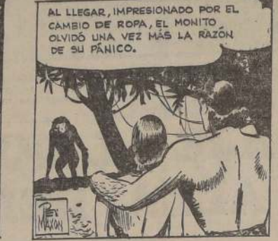
POCO DESPUÉS, JANE Y TARZAN REEMPLAZARON EL ATAVIO HECHO JIRONES POR EL RECIENTE CONFECCIONADO.

S. SACK FIERRO NACIONAL RECORDER CUMMINGS PLANO S. PABLO 1179 MORANOE 817