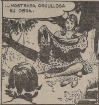
POCO DESPUÉS, JANE Y TARZAN REEMPLAZARON EL ATAVIO HECHO JIRONES POR EL RECIENTE CONFECCIONADO.