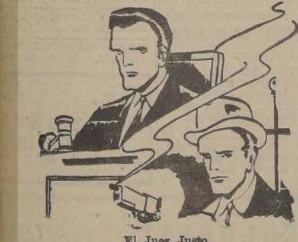
El Juez Justo

LA NACION, en un impulso renovador, hará llegar también a sus lectores algunas de las más interesantes y novedosas de esas historietas, para deleite de hombres y mujeres, de niños y de viejos.