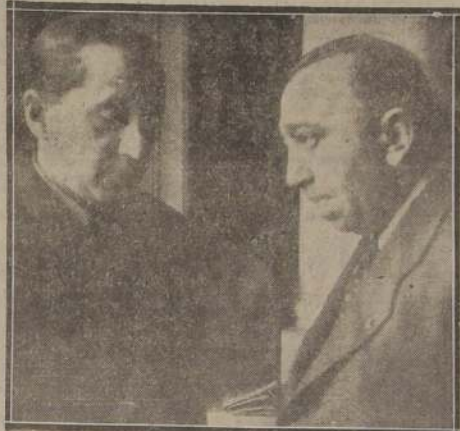
El diputado señor Bernardo Leighton, formulando declaraciones a uno de nuestros reporteros

Le comunica, al mismo tiempo, que suspendió el comicio que había acordado realizar anteayer para evitar dificultades al Gobierno frente al clima de violencia derivado de la actitud de los autobuseros.