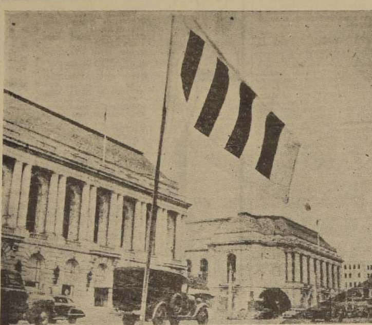
La bandera de las Naciones Unidas trémula frente al edificio de la Opera de San Francisco de California, donde sesiona la Conferencia. El pabellón aliado está formado por 5 barras rojas (que simbolizan las 4 libertades) sobre campo blanco que representa la paz.