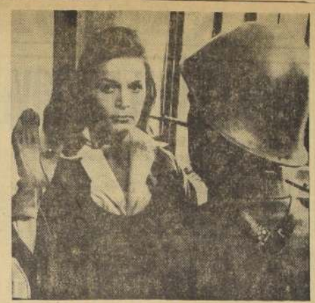
EVA BARTOK, la famosa estrella húngara del cine británico, encarna una heroína de la resistencia clandestina de los holandeses ante el invasor alemán durante la época de la última guerra, en el film "Operación Amsterdam".