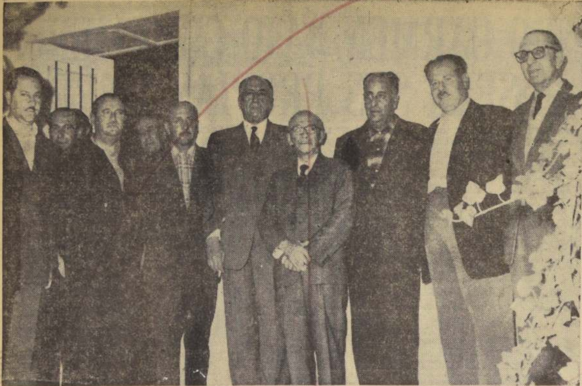
PARCELAS PARA GANADERIA.— Otra de las realizaciones de los planes de Reforma Agraria del Supremo Gobierno, mediante la aplicación del DFL N.º 76, es la subdivisión de tierras para entregarlas a parceleros que las destinen al aumento de la ganadería ovina. Recientemente se hizo entrega de cinco parcelas de la Hacienda San Martín, de 4.980 hectáreas, que será dedicada exclusivamente a la cría de ovejas, lo que permitirá un aumento en los abastecimientos de carne de la población y la producción de lanas. En el grabado, el Ministro de Tierras y Colonización, Enrique Bahamonde; el Vicepresidente de la Caja de Colonización, Jorge Baraona Puelma; el Consejero de esa institución, Enrique Besa Vicuña, y otros funcionarios, departen con los parceleros de la Hacienda San Martín, ubicada en el Departamento de San Antonio, que ayer concurrieron a la Colonia Agrícola "Arturo Lyon Peña" para recibir sus títulos de dominio. Los favorecidos con estas parcelas, son Daniel Claro, Rafael Astorga, Roberto Peralta, Sergio Barros y Alberto Eskenazi, quienes pondrán toda su experiencia y trabajo, para cumplir con las esperanzas y confianza depositadas en ellos, para que trabajen y hagan rendir sus tierras en la especialidad de la ganadería ovina.