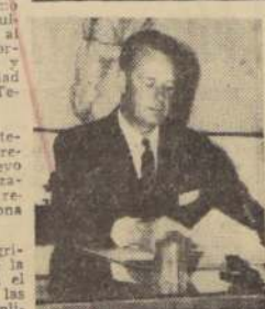
EL ACUERDO Después de estos antecedentes, que el espacio obliga a dar en sus partes sustanciales, se acordó: