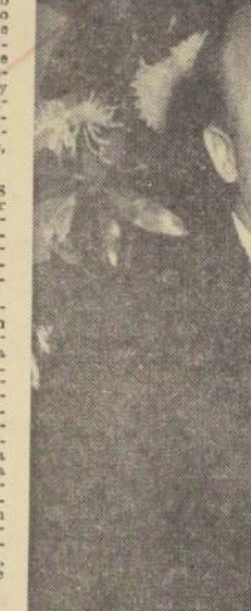
Enrique Tejera, presidente de la Corporación Nacional de Petróleo, en una de las grandes cabeceras de la economía venezolana, nos visita con motivo de la reunión de la CEPAL.

El sistema de alfabetización puesto en marcha, que es el más rápido del mundo, incluida la Unión Soviética, que tanto se jacta de sus progresos educativos. En un solo Estado se abrieron —en dos meses— 1.600 escuelas, es decir, más que todas las que se abrieron en 120 años de vida independiente. El auge universitario es también digno de especial mención. Pero, tal vez la mayor realización de Betancourt ha sido una re-