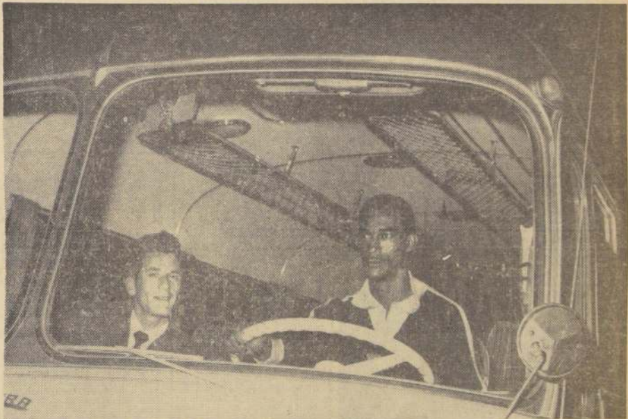
TODO LE ESTA permitido a Didi, extraordinario insider del cuadro brasileño. Aquí lo vemos cuando toma el volante del microbús que los conduce a la visita y prácticas que han cumplido en Viña del Mar y Valparaíso. Ayer, en el estadio "Sausalito", una multitud presenció el entrenamiento de los cracks.

En el Gimnasio de la Federación se inicia esta tarde el campeonato de apertura del básquetbol de la "U", con un programa que consulta ocho partidos, según el siguiente orden: 14.45 horas: Ingeniería Forestal-Agronomía (Ascenso); 16: Constructores Civiles-Veterinaria (As.); 18: Aviación con Farmacia (Honor); 19: Fisico-Carabineros (Honor); 20: Dental-Arquitectura; 21: Medicina-Ingeniería (Honor); 22: Normal-Pedagógico (Honor); 23: Sociología-Ciencias Políticas (As.). Fuera de los conjuntos nombrados, intervienen: Internado Barros Arana, en carácter de invitado; Economía y Leyes.