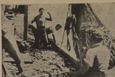
LA RIQUEZA DEL MAR CHILENO