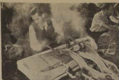
OBREROS MAESTROS EN SASTRERIA

Estos pequeños alumnos, hijos de obreros de la Fca. de Cemento Melón, muestran en esta fotografía, rasgos de tenaz constancia y de enérgica decisión que, indiscutiblemente, marcan la estatura física y moral del obrero chileno. Esta fotografía fue tomada en la Escuela que la Empresa de Cemento Melón tiene instalada en La Calera y que dirigen los Hermanos Maristas.