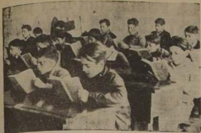
HIJOS DE OBREROS EN LAS ESCUELAS

Estos pequeños alumnos, hijos de obreros de la Fca. de Cemento Melón, muestran en esta fotografía, rasgos de tenaz constancia y de enérgica decisión que, indiscutiblemente, marcan la estatura física y moral del obrero chileno. Esta fotografía fue tomada en la Escuela que la Empresa de Cemento Melón tiene instalada en La Calera y que dirigen los Hermanos Maristas.