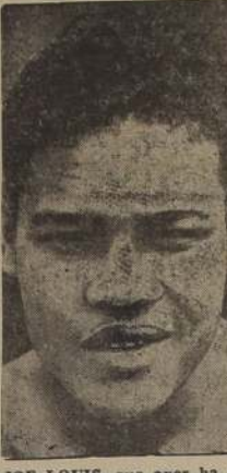
JOE LOUIS, que ayer ha sido desafiado por el título de campeón de peso pesado. Su desafío es Joe Walcott.