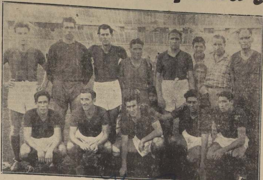
ENTRENARON AYER.—El conjunto titular de San Lorenzo de Almagro, que entrenó ayer en la tarde en la cancha N.º 1 del Estadio Nacional. Hicieron poco fútbol y bastante gimnasia. El practice era en privado, pero asistió mucho público.

También desde la misma hora funcionarán todas las boleterías del Estadio Nacional.