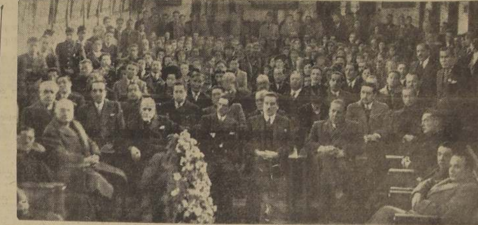
Aspecto general de la velada realizada en la tarde de ayer, en el local de la Sociedad Dávila Baeza, en honor de Bolivia. Aparecen, en primer término, el Encargado de Negocios del país hermano, miembros honorarios de la Sociedad, dirigentes de la misma y representantes de entes congéneres.

El programa de mañana, día nacional del país hermano