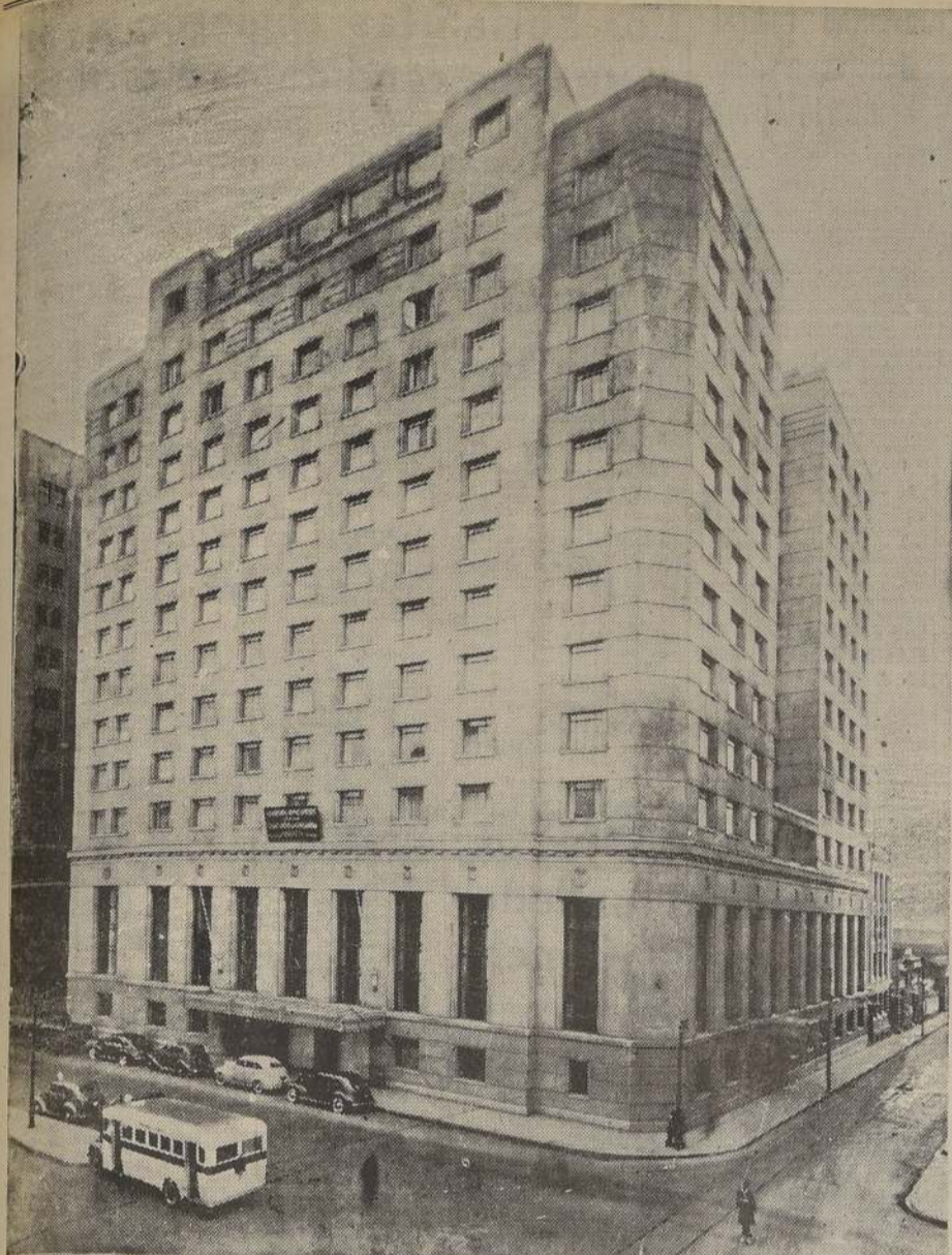
Imponente aspecto que presenta la fachada del Edificio Carrera