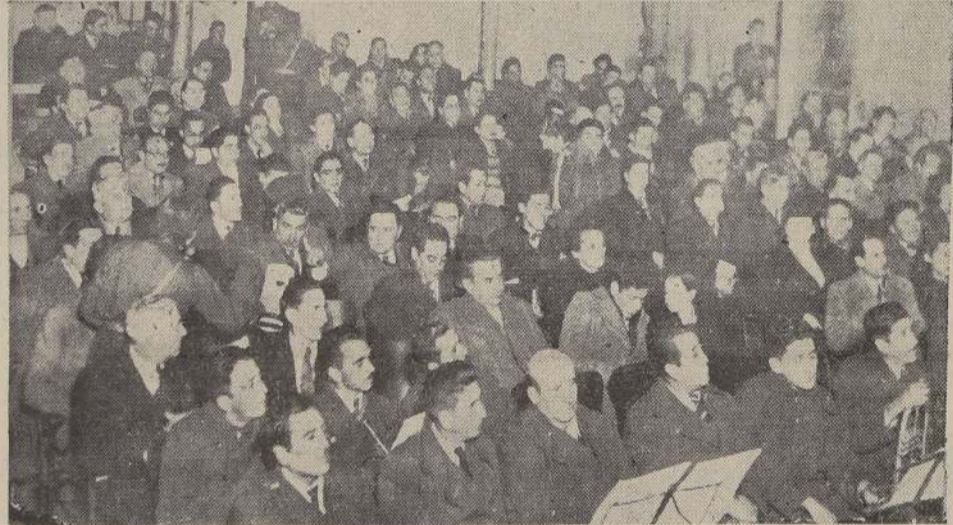
Un aspecto del Teatro Miraflores durante el acto de ayer en homenaje del fundador del Partido Democrático, D. Malaquías Concha

Con ocasión del 19.º aniversario de su muerte, se realizó ayer un brillante homenaje a su memoria.— El acto efectuado en el T. Miraflores