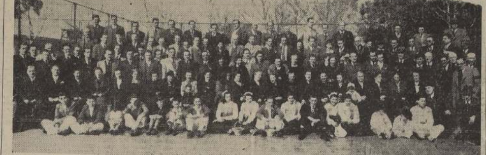
Grupo de asistentes a la brillante manifestación que se efectuó ayer en el Stade Francés, organizada por la Juventud Vasca.

Artículo 14.º Los dueños de conventillos que no reúnen las condiciones requeridas de seguridad e higiene, serán notificados de que sus inmuebles ajenos a las condiciones de seguridad e higiene, han sido declarados insalubres.