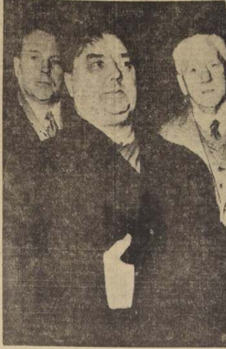
LONDRES.— El ex Premier soviético, Georgi Malenkov, posa para los reporteros gráficos a su llegada a las Islas Británicas, donde pasará tres semanas dedicadas a inspeccionar las plantas generadoras de energía eléctrica. En su país Malenkov desempeña el cargo de Ministro de Plantas de Fuerza Eléctrica. Con él aparecen el Embajador soviético en Londres, Jacob Malysk (izquierda), y Sir Walter Citrine, presidente de la Comisión Británica de Electricidad.

Esta mañana Malenkov se dirigió en su gran automóvil negro "zís", desde la Embajada soviética al edificio de la Administración Central de Electricidad, próxima al Oxford Circus. Detrás de su coche iba un autobús con sus 39 asistentes ocupados por miembros de su