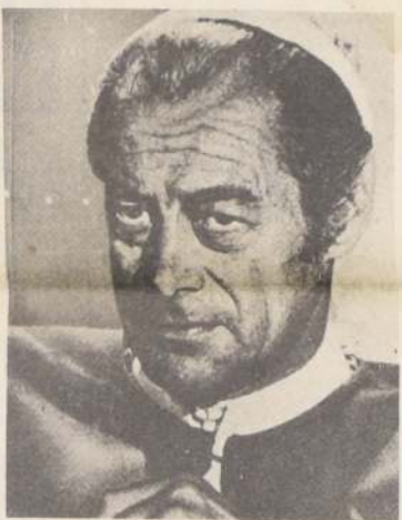
Rex Harrison en su papel del Papa Julio II, en el film "La agonía y el éxtasis".

Heleno, el "Kojac" de la canción argentina, se va a ir directamente desde el aeropuerto de Pudahuel, adonde llegará hoy a los estudios de Canal 13, donde grabará un especial que, por supuesto, incluirá la famosa canción "La chica de la boutique", y otras novedades.