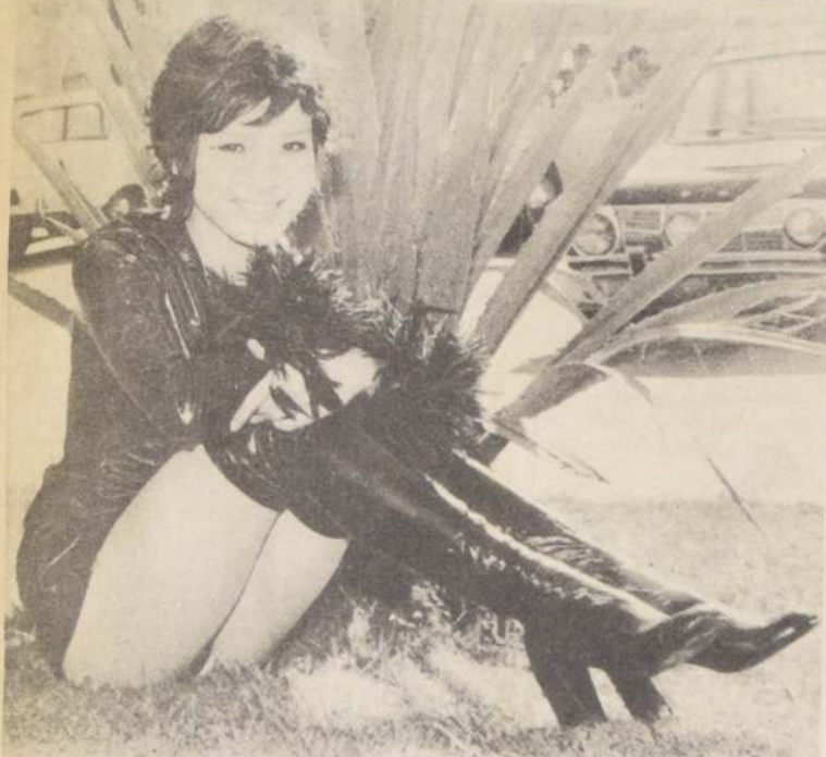
La simpatísimas japonesita KAORO YUMI, asistió invitada al Festival de Viña del Mar 1971, y según cuentan las brujas del correo, (¿o es el correo de las brujas?) bueno, no importa, según

cuenta, tiene muchas ganas, muchísimas ganas de volver a dar su vueltecita por aquí. Que lico, como dice Kung-Fu.