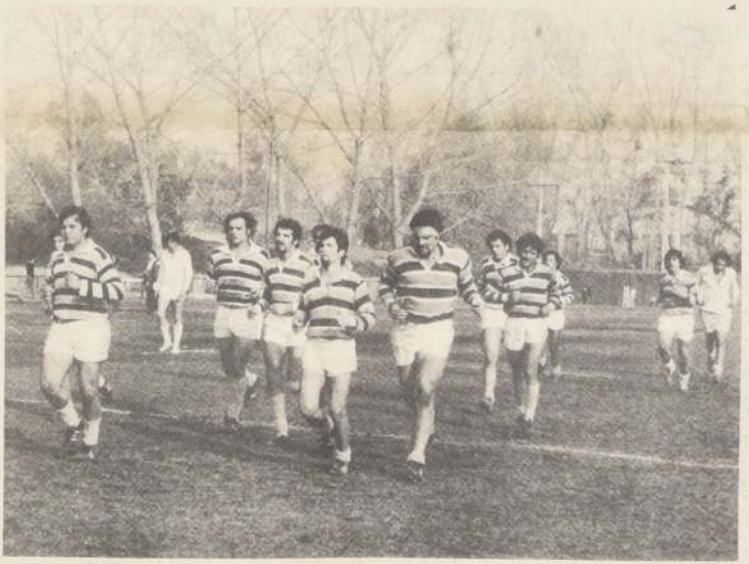
El "quince" del Liceo Militar de Mendoza, de buena actuación en nuestras canchas, pese a su calidad, aporta un solo nombre a la selección de

El representativo mendocino llega hoy a nuestro país y mañana efectuará una breve práctica en el recinto galo. Nota destacada es el hecho de que en este elenco actúan tres de los seleccionados oficiales de Argentina, jugadores que "mostrarán" un poco la fuerza y técnica de los conocidos "pumas".