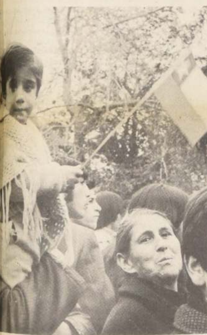
MOLO IMPERECEDERO de lo que fue la multitudinaria reunión en el Parque Bustamante. El niño, la reserva de Chile, enarbolaba la bandera tricolor en los brazos de su padre. La anciana mira nuestra bandera con orgullo. Así le gritamos al mundo que estamos felices con el Gobierno militar.

Muchos pequeños esfuerzos harán grande a Chile