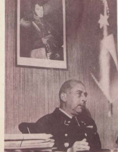
MINISTRO DEL TRABAJO, General Nicanor Díaz, Gobierno obligado a cumplir con los derechos de los trabajadores.

Interrogado, finalmente, sobre la reforma del Código del Trabajo dijo que a mediados de octubre se esperaba convocar a los dirigentes sindicales para descentralizar, mejorar o modificar la reforma redactada, en lo que se refiere a la reforma de la organización sindical y a la negociación colectiva. En cuanto a las otras partes de la reforma no hay aún fecha para las discusiones.