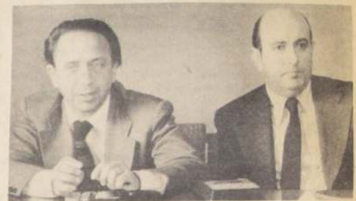
Los Ministros de Economía, Fernando Léniz y de Hacienda, Jorge Cauas, informan del reajuste.

Por otra parte, anunció la creación de un nuevo sistema inspectivo, destinado a resguardar el cumplimiento de las leyes de acaudamiento, y los derechos de los trabajadores. Se trata —explicó— de realizar visitas inspectivas conjuntas con funcionarios del trabajo, cajas de previsión y de Impuestos Internos, a los Centros productivos y empresas en general.