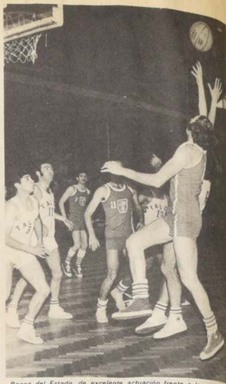
Banco del Estado, de excelente actuación frente a la selección de Talca, tratará de mantener su invicto frente a Universitaria.

El sistema suizo hace jugar entre sí a los participantes que tienen puntajes iguales, lo que le da mayor animación y permite que compitan gran cantidad de jugadores en torneos de corta duración.