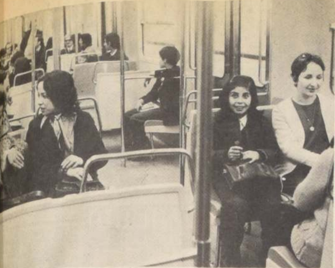
Las primeras "pasajeras" del Metro de Santiago. Ayer la Dirección General abrió al público las dependencias de la Estación Moneda, para mostrar lo que se ha hecho, bajo los "hoyos" de la Alameda Niños, hombres y mujeres se posicionaron en asientos y pasarelas de los coches para observar cada detalle de los carros, que constituirán el principal medio de transporte en la capital, a partir del año próximo.