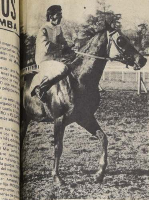
Ortega, un figurar con ejemplares que pone apenas regulares. Merece más oportunidades y que suele

Por otra parte, se designó una comisión, presidida por el Coronel de Carabineros Osvaldo Sepúlveda e integrada por Julín Serra, en representación de la Asociación de Propietarios, con el objeto de que proponga una racionalización en lo relativo a la eliminación, a fin de hacer el sistema más operante y acorde con el desarrollo experimentalmente por la actividad hipica.