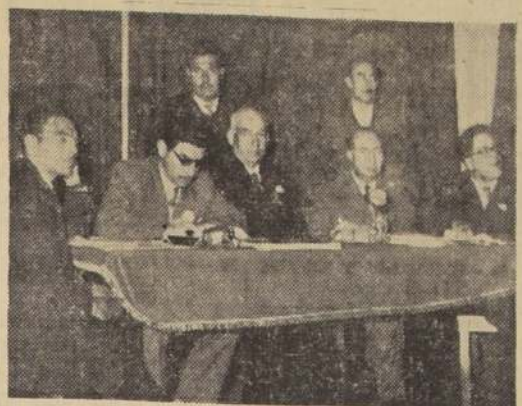
El Ministro de Salud Pública, señor Vassallo, acompañado de dirigentes de la Convención.

El Ministro de Salud Pública, señor Carlos Vassallo, acompañado de dirigentes de la Convención.