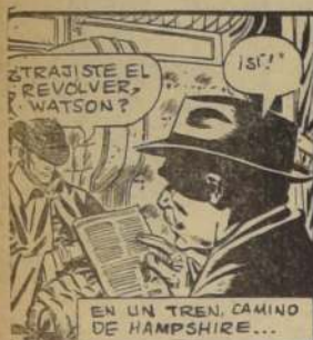
EN UN TREN, CAMINO DE HAMPSHIRE...