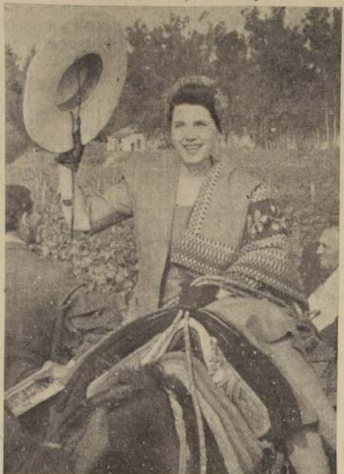
Libertad Lamarque, la más popular y aplaudida estrella cinematográfica sudamericana, fue objeto ayer de una simpática demostración. La gerencia de la Vina Concha y Toro, en Pirque, ofrecieron a la famosa artista un almuerzo, en las bodegas de la Vina, ubicada en Pirque.

FUE OFRECIDO POR LA GERENCIA DE LA VINA CONCHA Y TORO, EN PIRQUE