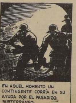
EN AQUEL MOMENTO UN CONTINGENTE CORRÍA EN SU AYUDA POR EL PASADIZO SUBTERRÁNEO.