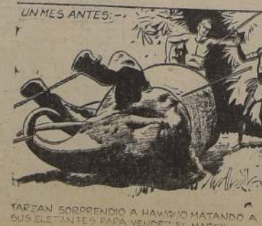
TARZAN SORPRENDIÓ A HAWQUO MATANDO A SUS ELEFANTES PARA VENDER EL MARFIL.