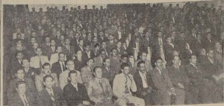
Aspecto de la concentración celebrada por el Consejo Ferroviario de San Bernardo en el Teatro Municipal de esa ciudad.

Aprobaron acuerdos en pro de la gratificación anual. — Un voto de adhesión al Ministro de Fomento, por su labor de mejoramiento obrero