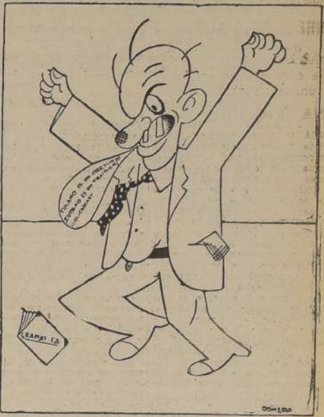
El candidato X expone su interesante programa político

de los Secretariados Seccionales y Secretarías de Seccionales de todas las Seccionales del primer distrito y de las Seccionales de Chuchun-