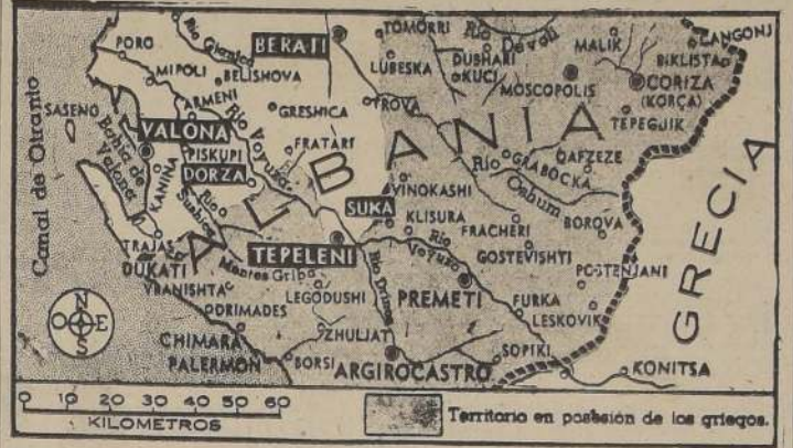
Territorio en posesión de los griegos.