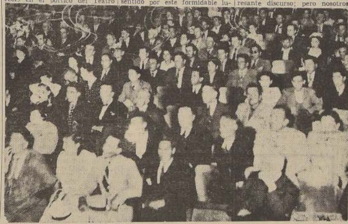
Parte de la concurrencia a la concentración del Teatro Coliseo

litares y altos funcionarios del Ministerio de Educación. Finalmente la ceremonia con un cocktail, durante el cual harán uso de la palabra el Embajador alemán y el Ministro de Educación.