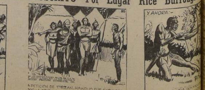
A PETICION DE TARZAN, HAWQUO FUE EXPULSADO POR LA TRIBU SUYALANADA DE LOS KOLONIDE.