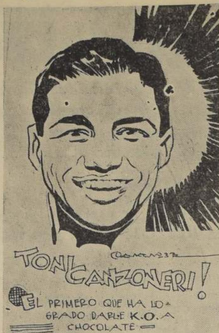
Tonny Canzoneri, el ex-campeón mundial de peso liviano, que antecede reconquistó su título, siendo este caso único en la historia del boxeo mundial

Canzoneri es el primer caso de un campeón mundial que reconquista su título.