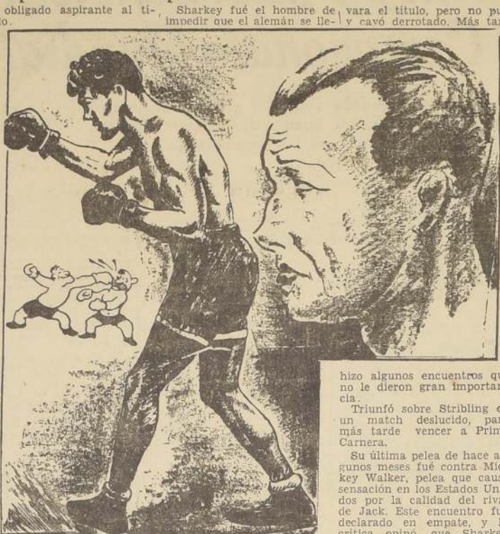
Schmelling y Sharkey, los contendores de esta noche.

El americano Sharkey es un eterno aspirante al Campeonato del mundo. Empezó su carrera famosa peleando con Dempsey siete sensacionales rounds en que perdió por K. O. Su fama de hombre peleador la conquistó en ese match y continuó siendo