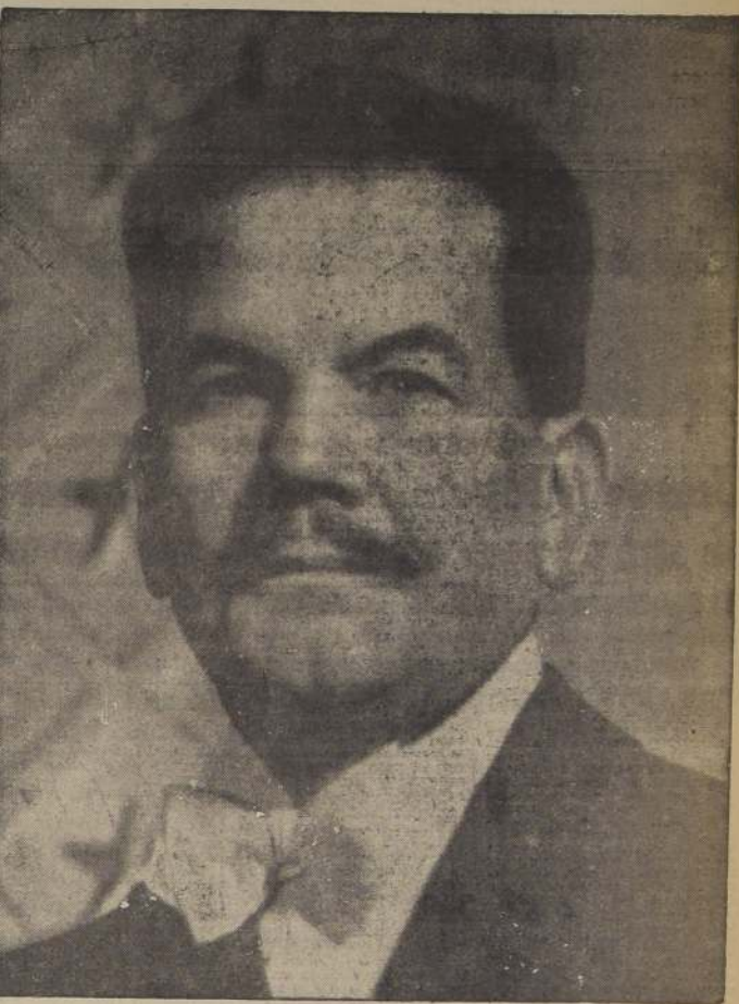
Hoy es el día onomástico del Excmo. señor Pedro Aguirre Cerda. Con tal motivo, en el Palacio Presidencial de Viña del Mar, recibirá los saludos de las delegaciones de las Fuerzas Armadas, de los Secretarios de Estado, autoridades locales, altos funcionarios públicos, miembros del Parlamento y de los partidos políticos del Frente Popular.