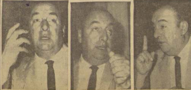
Tres gestos del poeta en la conferencia de ayer.— (INFORMACION PAG. 3)