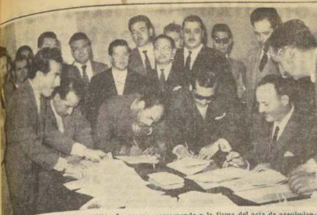
DIRIGENTES DE EL TENIENTE.— La escena corresponde a la firma del acta de avenimiento que puso fin al conflicto de obreros y empleados de la Braden Copper, ayer en el Ministerio del Trabajo. En el grupo, el ministro del ramo, Hugo Gálvez. Observa el resto de la comitiva sindical.