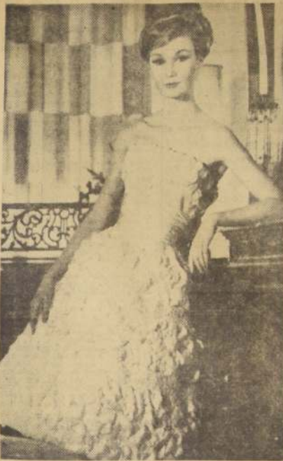
Vestido de cocktail en chiffon abullonado blanco, sobre fondo rosado. Lleva una faja en seda natural rosada.