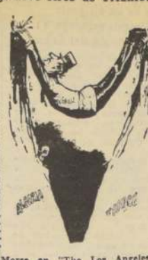
Morse en "The Los Angeles Mirror-News"