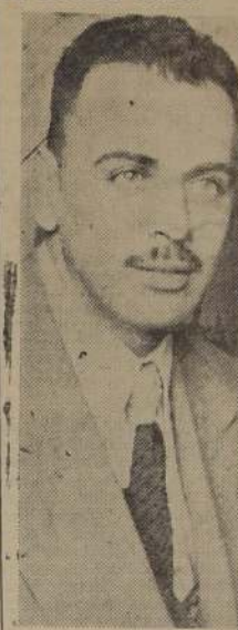
Anteayer llegó a Santiago, de regreso de Estados Unidos, don E. Grandi, senador por la provincia de Valparaíso.