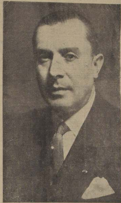
S. E. el Presidente de la República al invitar a la oposición al Gabinete, reiteró su resolución de mantener inalterables las garantías electorales.