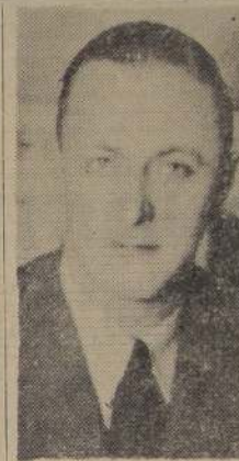
LADISLAO ERRAZURIZ: "Los pactos no entorpecen el libre juego de los partidos".