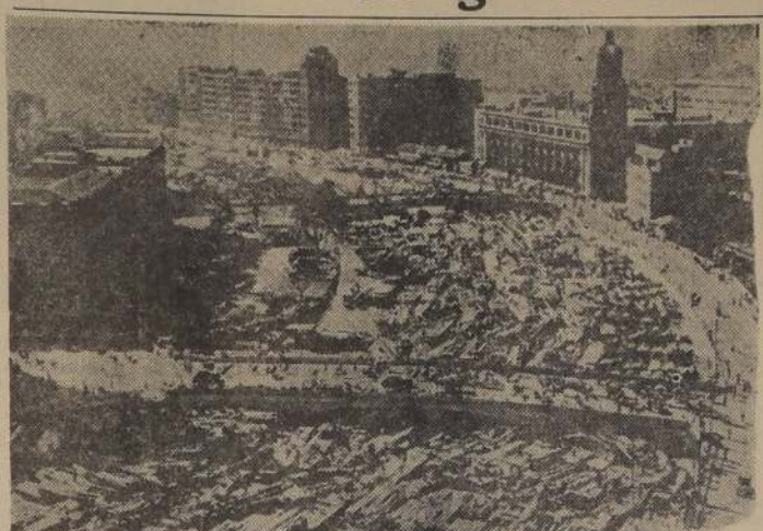
El Río Yang-tzé en Shanghai literalmente lleno con millares de embarcaciones que transportaron a los refugiados de Suchow, que huyeron ante el avance de los comunistas. Muchos de esos fugitivos viven a bordo de sus barcas.