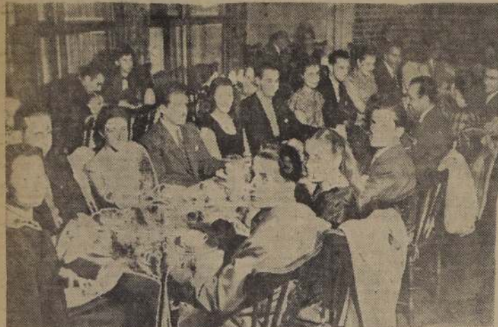
Aspecto tomado en la hora de comida en la Hostería.