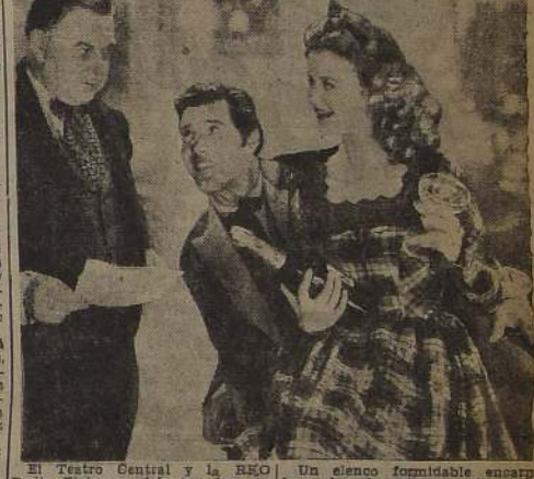
El elenco formidable encarna los roles de esta magnífica película, encabezado por Walter Huston, un actor que es hoy gran revelación en los Estados Unidos, y que ganó el Premio de la Academia de Artes y Ciencias Cinematográficas de Hollywood por su rol en esta producción.