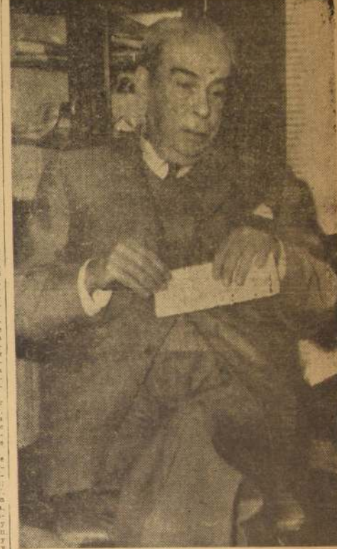
CIUDAD DE MEXICO.— El ex Presidente de Venezuela, Rómulo Gallegos, aparece aquí en la biblioteca de su casa, el 2 de enero, después de leer el relato de la United Press de la revolución venezolana, de corta vida. Gallegos, de 73 años de edad, huyó de Venezuela en 1954, después de haber sido derrocado por el presidente venezolano, Marcos Pérez Jiménez. El mismo Gallegos vio cómo su Gobierno constitucional cayó en golpe dado por Pérez Jiménez en 1949.