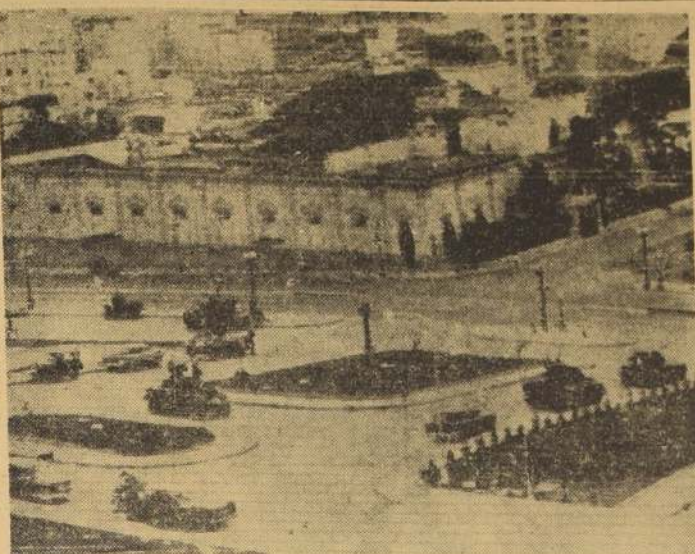
CARACAS (Venezuela).— El Palacio de Miraflores, del Presidente Pérez Jiménez, se ve fuertemente custodiado por tanques equipados con cañones antiaéreos y ametralladoras. La foto a que corresponde el presente grabado fue tomada en las primeras horas del 2 de enero, al día siguiente de la rebelión de Año Nuevo. El Palacio de Miraflores es el edificio bajo, estilo hacienda, que se ve a la izquierda.

Barclay subrayó que la producción no pasará de 100 a 200 proyectiles mensuales. "La producción de cada proyectil es análoga a la de una locomotora o un barco, pues cada unidad lleva alrededor de 40.000 piezas sueltas, y una sola falla podría inutilizarlo al momento de lanzarlo".