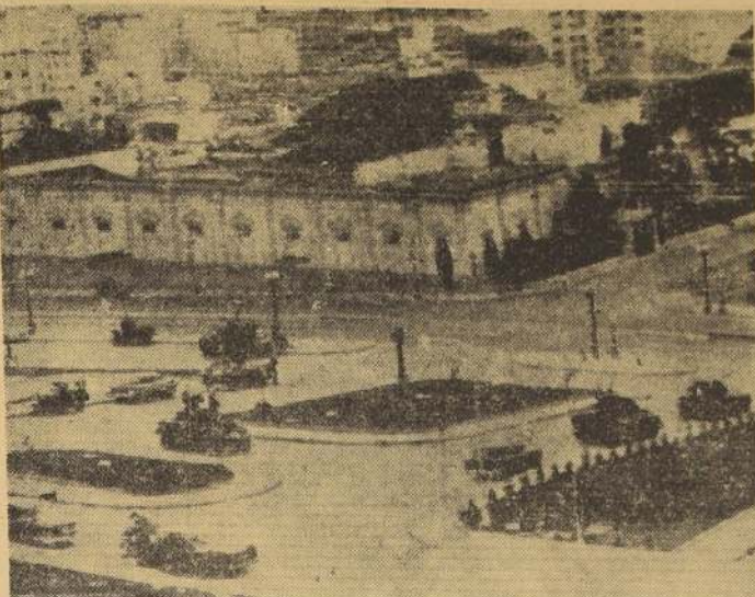
CARACAS (Venezuela).— El Palacio de Miraflores, del Presidente Pérez Jiménez, se ve fuertemente custodiado por tanques equipados con cañones antiaéreos y ametralladoras. La foto a que corresponde el presente grabado fue tomada en las primeras horas del 3 de enero, al día siguiente de la rebelión de Año Nuevo. El Palacio de Miraflores es el edificio bajo, estilo hacienda, que se ve a la izquierda.

CHICAGO, 3 (UP).— El general A. A. Barclay, subdirector del programa de proyectiles balísticos del ejército, dijo hoy que el proyectil "Júpiter", para distancia de 2.500 kilómetros, está listo a fines de este año para el Ejército de Estados Unidos y las fuerzas de la Organización del Atlántico Norte (OTAN). El general Barclay reveló también que "dentro de unas horas" el Ejército anunciará la adjudicación de un contrato a la Chrysler Corporation para la producción de dicho proyectil. El "Júpiter" ha sido diseñado para ser lanzado desde un cohete, y se espera que el Ejército pueda tenerlo listo para fines de año, para su lanzamiento a las fuerzas que han recibido instrucción para usar el proyectil. Barclay subrayó que la producción no pasará de 100 ó 200 proyectiles mensuales. "La producción de cada proyectil es análoga a la de una locomotora o un barco, pues cada unidad lleva alrededor de 40.000 piezas soldadas, y una sola falla podría inutilizarlo al momento de lanzarlo".