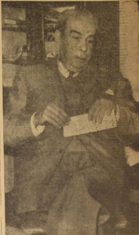
CIUDAD DE MEXICO.— El ex Presidente de Venezuela, Rómulo Gallegos, aparece aquí en la biblioteca de su casa, el 3 de enero, después de leer el relato de la United Press de la revolución venezolana, de corta vida. Gallegos, de 73 años de edad, hijo de más o menos 1.000 exilados venezolanos en la capital mexicana, predijo que continuará la lucha contra el Presidente venezolano, Marcos Pérez Jiménez. El mismo Gallegos vio cómo su Gobierno constitucional cayó en golpe dado por Pérez Jiménez en 1949.

El joven criado logró llegar al puesto militar de su patrón después de una marcha de 120 kilómetros, a través de la densa selva, durmiendo en las copas de los árboles y comiendo frutas silvestres.