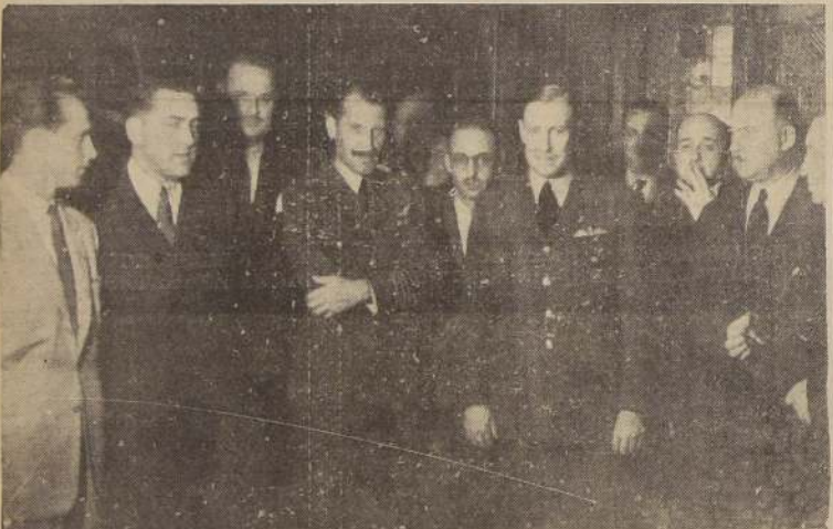
Durante el cocktail en el Crillon

ADICTO DE PRENSA A LA EMBAJADA DE GRAN BRETAÑA OFRECIO UN COCKTAIL EN SU HONOR EN EL CRILLON.— SEGUIRA VIAJE A ARGENTINA