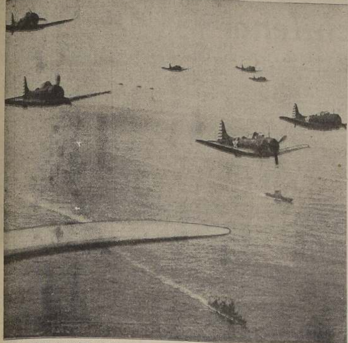
Unidades aéreas de la flota portuaria americana explorando el Pacífico en busca del enemigo. Obsérvese el impetuoso de los bombarderos. Un grupo de unidades de esta clase causó grandes estragos entre las posiciones militares japonesas en las islas Marshall y Gilbert con una lluvia constante de explosivos procedentes de cañones pesados y bombardeo de picada.