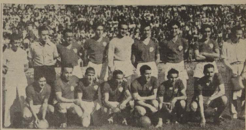
Equipo del Santiago Wanderers, de Valparaíso que esta tarde se enfrentará al Colo Colo en el Estadio de Carabineros. El team porteño ha realizado últimamente una lucida campaña y se presenta como un difícil adversario para el campeón de 1941

La misma institución mencionada en primer término enfrentará mañana con sus tres equipos a los del Deportivo Estrella Solitaria, en la cancha situada en Carriz 1725. Iniciarán la reunión los terceros cuadros a las 14.30 horas.