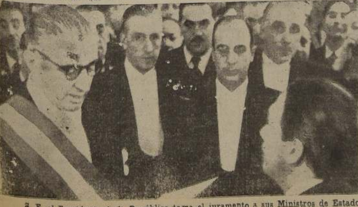
S. E. el Presidente de la República toma el juramento a sus Ministros de Estado.