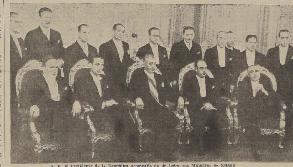
S. E. el Presidente de la República acompaña de todos sus Ministros de Estado

Medina Neira, Ministro de Tierras y Colonización, a don Pedro Poblete Vera; Ministro del Trabajo, a don Leonidas Leyton; Ministro de Salubridad,