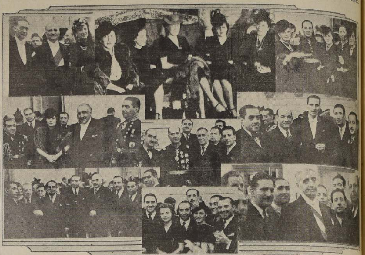
Diversos aspectos de la recepción ofrecida ayer en la Moneda por S. E. el Presidente de la República y señora María Ide de Ríos. Arriba, al centro, la esposa de S. E. rodeada de las esposas de los Ministros de Estado.

Las Embajadas Extraordinarias, el Cuerpo Diplomático, los miembros de los Poderes Legislativo y Judicial, las autoridades civiles y militares y numerosas personalidades, pasaron ayer a presentar sus respetos al Primer Mandatario y señora