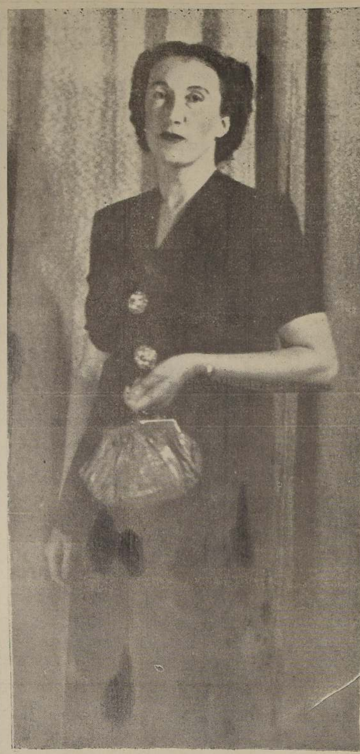
Señora María Irujo de Ríos, esposa del Sr. Ríos Morales, Presidente de la República, don Juan Antonio Ríos Morales