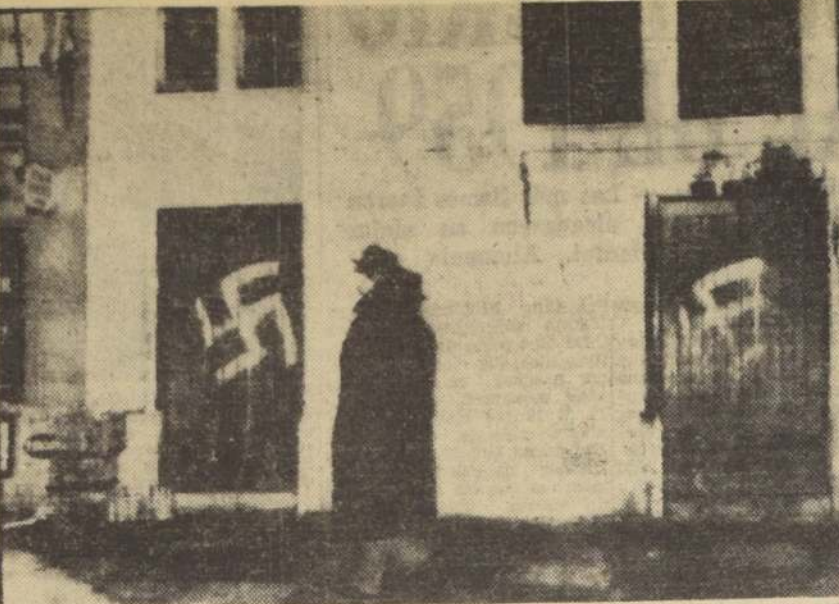
LONDRES. — Un transeúnte observa un slogan antisemita y una gigantesca svástica pintada en los muros de una sinagoga en el barrio de Notting Hill, en esta capital, el 31 de diciembre. Se han dado urgentes órdenes a Scotland Yard (policía inglesa) para determinar los responsables de estos ultrajes. Parecidos actos de vandalismo se han observado en las ciudades de Alemania occidental en dos ocasiones durante esta semana.

En el exterior, se anticipa que el alto entendimiento de que el organizador de ultramar para todos los gastos de la declaración conjunta señalada que "toda invitación a atletas británicos, para que com-