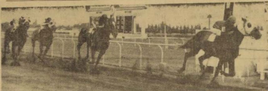
TORPEDERO, gana el primer clásico del Hipódromo Chile, el tradicional premio "Año Nuevo". Total recuperación de su pendera le permitió demostrar el hijo de Teodolito.

Este hijo de Nasr-ed-Din, que entra Rosalindo Rabello, había llegado a los 4 años sin lograr cambiar de categoría y era por lo tanto uno de los "outsider" en las cotizaciones. Por un cuerpo se impulsó a Petulante. Favorito eligieron a