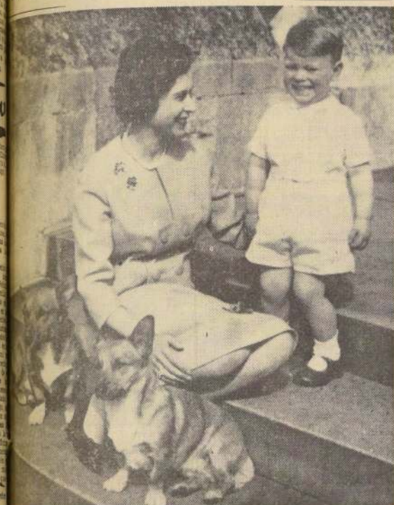
En esta fotografía, tomada recientemente en Inglaterra, el príncipe Carlos, heredero al trono británico, se ve con su madre, la Reina Isabel II, durante una de las tradicionales del Castillo de Windsor. El pequeño príncipe, que cumplirá tres años el 19 de febrero próximo, está segundo en la lista de herederos al trono británico.