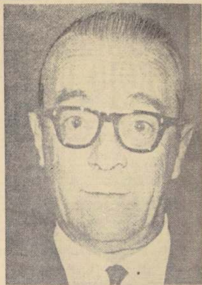
El Presidente de Argentina, José María Guido, está nuevamente amenazado por una fracción del Ejército, que no está de acuerdo con él. El peligro de una guerra civil se hace cada vez más próximo en la vecina República.