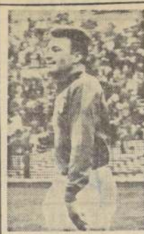
ALTAFINI: piloto del ataque de Milán, le hizo 2 de los 5 tantos de la goleada que propinó a Unión de Luxemburgo.

La pequeña dosis de boxeo que tuvo el encuentro al punto Selva, quien por lo menos empleó el jab de izquierda y tuvo algunos ataques de defensa, a base de bloqueo o esquivar. Pero no le alcanzó. El ataque sistemático de Rivero, la permanente amenaza de su pegada, desbordaron las pobres posibilidades de Selva, quien se agachó para evitar la izquierda de Rivero, pero no pudo evitar el golpe. Selva se agachó y Rivero no dejó de golpearlo. Selva se agachó y Rivero no dejó de golpearlo.