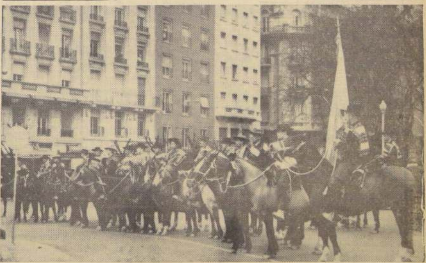
BUENOS AIRES.— Con diversos actos fue celebrado en Buenos Aires y en la mayoría de las ciudades argentinas, el 152.º aniversario de la Independencia de Chile. Bajo los auspicios del Embajador de Chile ante la Casa Rosada, se celebró la "Quincena de Chile", la que contó con un variado programa que incluyó un Rodeo a la Chilena en Palermo, al que concurrieron medio centenar de auténticos huascos, entre ellos, los mejores corredores en vaca que participan en las medallas criollas. En el grabado, la delegación de "huascos" montando sus propias cabalgaduras llevadas desde Chile, durante los homenajes que rindieron en los monumentos al General San Martín y al General Bernardo O'Higgins, en esta capital.

"Huascos" conmemoran el "18" en Buenos Aires