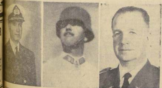
GENERAL CUBILLOS, GENERAL IZURIETA, GENERAL IENSEN