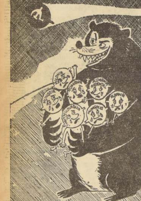
Experto en Satélites