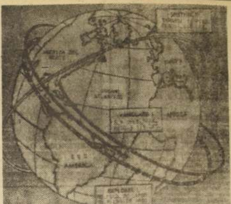
CABO CARAVERAL.— El gráfico muestra las órbitas de los tres satélites que están girando alrededor de la Tierra: el Sputnik II, de los rusos; el Explorer I, y el Vanguard I, de los Estados Unidos.

EL REGALO MAS APRECIADO PIJAMAS, BATAS DE LEVANTARSE, FUMADOR PARA SEÑORAS, CABALLEROS Y NIÑOS. SOMOS FABRICANTES. HUERFANOS 1165