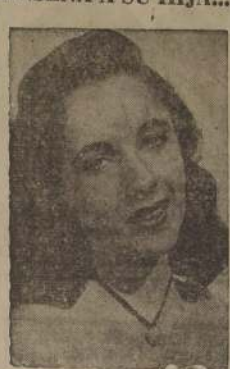
Elizabeth Taylor en "Mujercitas".

"Mujercitas" será presentada en el Teatro Metro, a continuación de la película "Fra Diavolo".