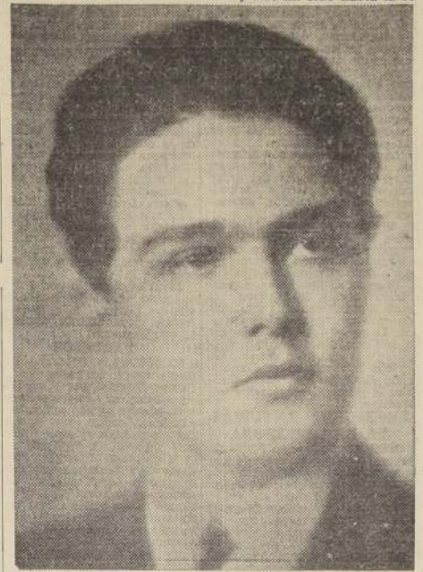
Otto von Habsburg