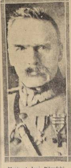
Mariscal José Pilsudski

VARSOVIA, 13. (U. P.) — Las multitudes han sido en torno al Palacio Belvedere, durante toda la mañana, para rendir homenaje a la figura del gran Mariscal Pilsudski. Los diarios, incluso los de la oposición, aparecieron todos con el nombre de "Pilsudski".