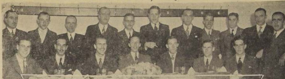
Asistentes a la manifestación con que el Directorio del Santiago Atlético festejó últimamente a los socios que participaron en el reciente Campeonato Sudamericano de Atletismo