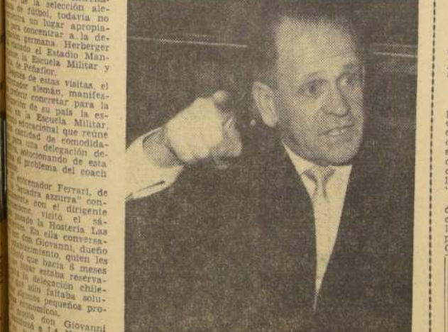
Sepp Heberger, el entrenador del seleccionado alemán, que ha estado buscando afanosamente un lugar de concentración para el equipo que jugará en el Mundial. Después de las visitas practicadas ayer, parece que se decidirá por la Escuela Militar.

Alemania lo hará entre el 15 y el 17 de mayo, viajando para el torneo mundial una delegación de 32 personas. Para mañana está anunciada la reunión que sostendrán las delegaciones que han viajado a las sub-sedes, con la Comisión encargada de recibir sugerencias y reclamaciones.