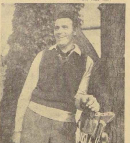
LEOPOLDO RUIZ: Primera figura del golf profesional argentino que será una de las atracciones del Campeonato Abierto de Santo Domingo.

Las inscripciones para ambos torneos se cerrarán hoy a las 21 horas. Los profesionales disputarán un premio de 600 dólares dividido en la siguiente forma: 200 al primero; 120 al segundo; 80 al tercero; 60 al cuarto; 50 al quinto; y del sexto al octavo lugar 30 dólares cada uno.