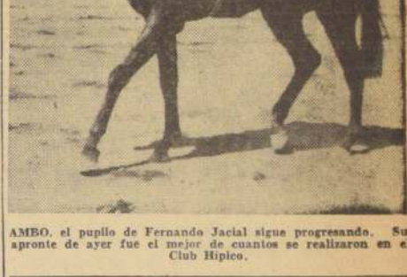
AMBO, el púgil de Fernando Jacial sigue progresando. Su apunte de ayer fue el mejor de cuantos se realizaron en el Club Hípico.

PRIMER PREMIO MUÑOZ GAMBRO. 1.000 metros. Carrera especial. 1.000 metros. PRIMER PREMIO MUÑOZ GAMBRO. 1.000 metros. Carrera especial. 1.000 metros. PRIMER PREMIO MUÑOZ GAMBRO. 1.000 metros. Carrera especial. 1.000 metros.