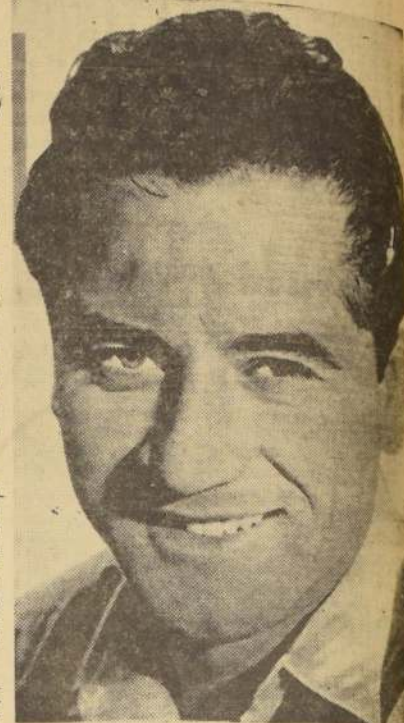
ADOLFO PEDERNERA es uno de los tres técnicos que se disputan para dirigir a la selección colombiana que vendrá al Campeonato Mundial.

■ GUADALAJARA, México. 22.— Luego de la victoria de Flamengo sobre Oro, tres por cero, y del empate a uno entre Guadalajara y Atlas, el puntaje del certamen pentagonal de fútbol es el siguiente: Atlas, 3 puntos; Flamengo y Guadalajara, 2; Universidad de Chile, 1; y tierra la tabla Oro con cero puntos.