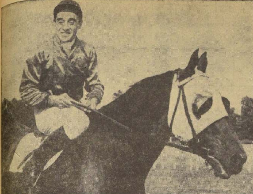
AMBO cumplió una gran faena en Rosaleen, la ganadora de "El Derby". Todos lo elogian su seriedad para avanzar en la reanudación del numeroso grupo y hacerla atropellar cuando ya los punteros habían cedido en sus afanes.