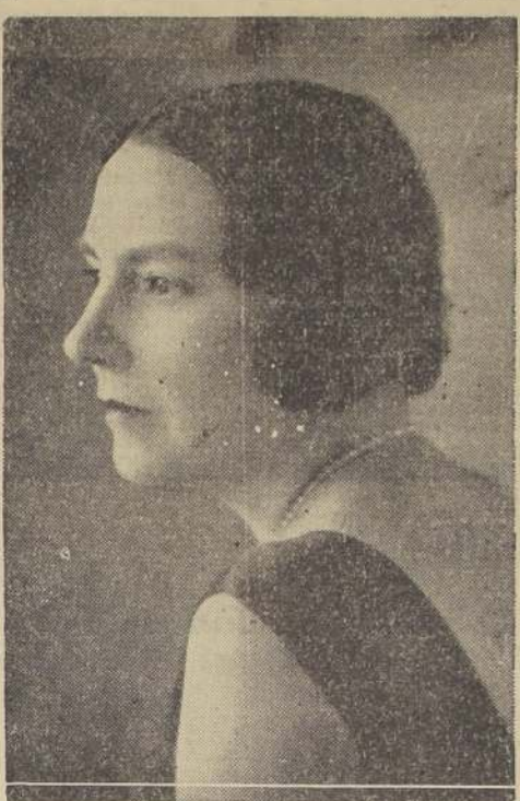
Condesa de Laigue, esposa del Cónsul de Francia en esta capital