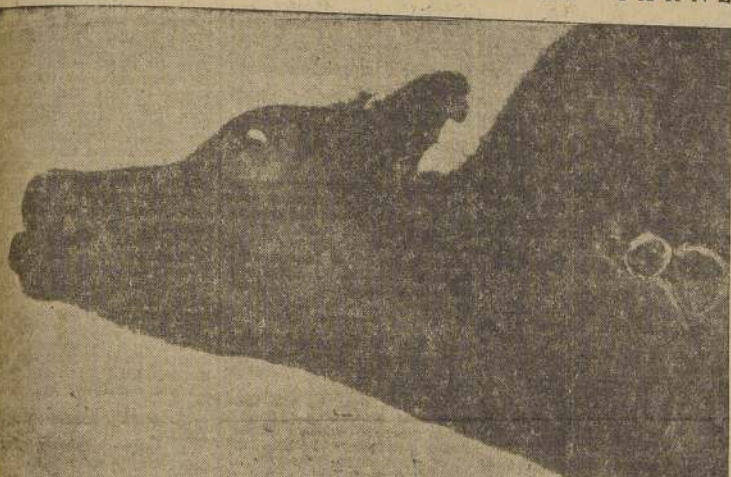
Sirve cualquier animal que se tenga que sacrificar

Se aprovecha cualquier animal que por razones del servicio o que por estar enfermo se deba sacrificar. Se descuartiza el animal después de separar el cuero, cuernos y patas, que no se aprovechan. Se desprende la carne de los huesos y se corta en pedazos de a 1 kilo, arrojándolos en un tacho con agua hirviendo, y también los huesos, los que se cortan con hacha. Los órganos internos como el corazón, hígado, etc., también son aprovechados. Se deja cocer hasta que los huesos queden completamente limpios de carne, lo que tarda 10 a 12 horas. A veces hay que agregar más agua para que el producto no se quemé. Una vez terminado el cocimiento se retira la carne del tacho y se pone en una prensa para ser exprimida. Esta operación demora de 20 a 30 minutos; en seguida se coloca la carne sobre tabloncitos a donde recibe los rayos del sol, la carne tardará 3 días más o menos en secarse, debiendo ser removida para que se seque por completo. Los huesos más grandes deben sacarse; en seguida se somete el total a la pulverización, para ser guardada y usada. Un animal de 500 kilos dará 50 kilos de harina seca. La grasa que sobrenada en el agua del tacho se aprovecha para la fabricación de jabón.