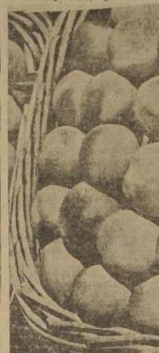
ejerce directamente sobre la flor. Entre la enorme cantidad de floración que se pierde cada temporada, y la cantidad que logra cuajar, hay gran desproporción. En algunas especies, el cinco por ciento es aprovechable.

El proceso de la fecundación tiene lugar en el interior de la flor, se genera con la fusión de ambos gametos, masculino y femenino, el grano de pólen y el óvulo que se encuentra en el interior de los carpelos. El contacto entre estos órganos es la polinización, y se efectúa en el momento en que está madura la parte femenina de la flor, que se impregna de una materia viscosa, con la que logra mantener el pólen. El momento de la polinización debe coincidir con la existencia de un grado favorable de temperatura que favorezca la germinación. Para que en una planta genéticamente haya fruto, es preciso que previamente se realice la fecundación de la flor que lo produce, es decir, es necesaria la formación de semillas fértiles. septiembre y en octubre. Cuando las plantas se sacan de las platabandas se podan, cortando los brotes que nacen hasta una altura de 8 a 10 cms. del cuello, a fin de formarlas con un solo tronco, teniendo cuidado de no cortar la raíz. Las plantas se entierran hasta el mismo nivel que tenían en las platabandas. Las flores que aparecen en la parte superior de las plantas se suprimen, para apresurar la producción y provocar la ramificación, dejándole 2, 3, 4 guías para extenderlas sobre el alambrado. A comienzos de primavera, en septiembre, se dan los primeros riegos, por los surcos hechos a ambos lados de las líneas. Cuando las plantas tienen 30 a 40 cms. deben polizarse igual que las vides.