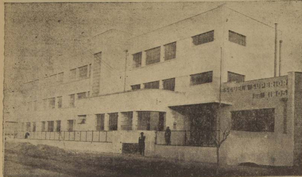
Fachada del nuevo edificio para la Escuela de Hombres de Puente Alto