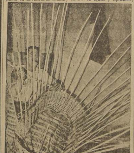
Para canastos se prefiere el mimbre fino y blanco

El sauce mimbre es una planta de gran importancia, debido a la utilización diversa de sus varillas. Se produce en toda clase de terrenos y permite aprovechar algunos suelos que no pueden plantarse con otros árboles. Especialmente se obtienen buenos rendimientos de esta planta, en las riberas de canales y