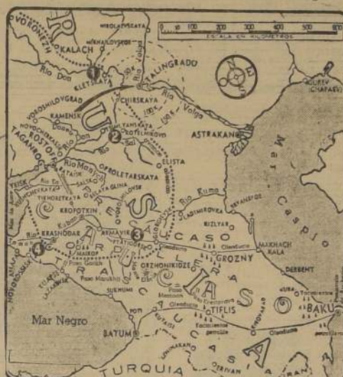
La flecha indica a Stalingrado, importante ciudad industrial soviética, objetivo inmediato de los invasores, quienes en su avance operan desde Kletska al este, indicada con el número 1, y desde Kotelnikovo, al sur, señalada con el número 2. Comunicados de origen ruso dan cuenta de que, en los últimos días se ha luchado encarnizadamente en los sectores de Kletska y Kotelnikovo, además, en los de Pryatigorsk, número 3, y Krasnodar, indicado con el número 4. De acuerdo con estas informaciones y las dadas a conocer en días anteriores, los ejércitos invasores habrían llegado en su avance hacia el oriente, hasta la línea de puntos que pasa por las proximidades de Voronezh, Kalach, Elita, Pryatigorsk, Malkop, Krasnodar y mar de Azov, en la forma que se indica en el esquema.