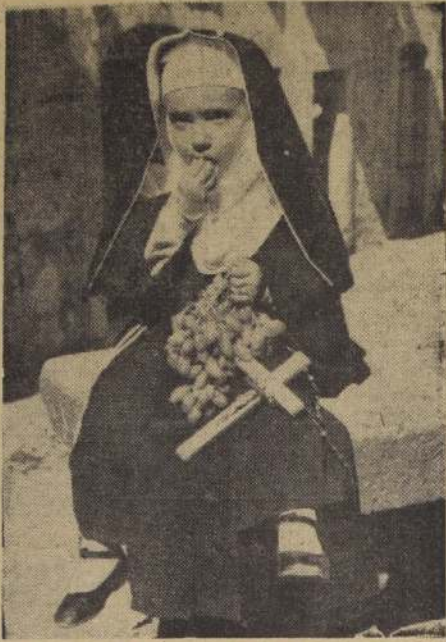
NO TRABAJA EN EL DIALOGO DE LAS CARMELITAS (MARIOL, Italia). — Con hábito de monja, esta artista muy grave, como una durante el Festival Anual de la Uva, en Marino, cerca de Roma, Italia. Es una costumbre popular para los niños en el sur de Italia vestirse como monjas o frailes, cuando sus madres hacen una manda o piden una bendición especial de parte de un santo patrono.

Gracias a esto, los archivos de la BBC contienen páginas de la historia, conservadas de manera que pueden revivirse en cualquier ocasión. Y, sin ir más lejos, una de esas ocasiones se producirá con motivo de un programa especial que