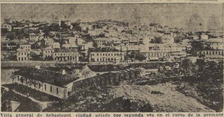
Vista general de Sebastopol, ciudad sitiada por segunda vez en el curso de la presente guerra. Esta plaza soportó también un largo asedio por parte de las fuerzas anglo-franco-turcas, durante la guerra de Crimea. (1854-1855)

Por la tarde, bombarderos medievales atacaron de la RFA. (PASA A LA PAGINA 6)