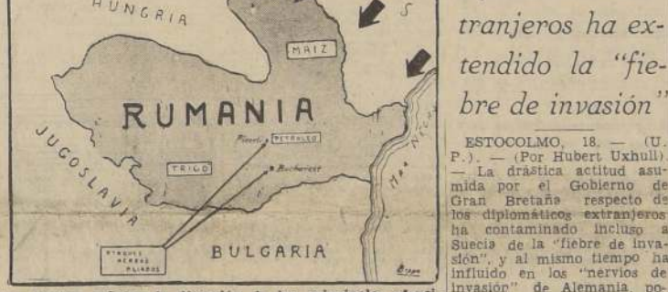
Las flechas señalan la dirección de las principales ofensivas rusas en Rumania, que tienen por objetivo final las fértiles llanuras de Moldavia y Valaquia, y los abundantes yacimientos petroleros de Ploesti

AUMENTA LA INTENSIDAD DE LA LUCHA EN YUGOSLAVIA