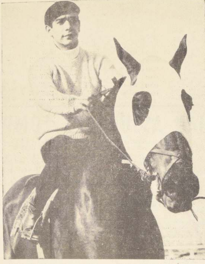
MICHICO TRABAJO AYER, preparando para el Clásico Nacional "Ricardo Lyon". Lo hizo en buenas condiciones, mostrando que será rival difícil de superar.