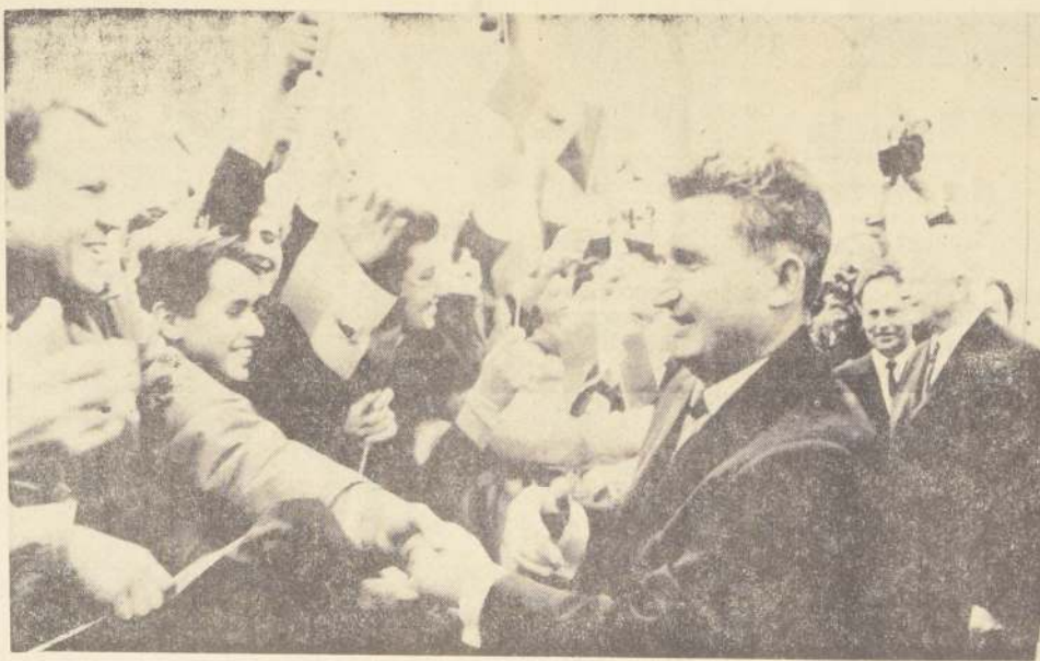
NICOLAE CEAUSESCU, secretario general de los comunistas rumanos y Presidente de la República. Su respaldo a las reformas de Dubcek y su condena de la intervención soviética, a pesar de los riesgos exteriores, le ha valido una renovada popularidad.