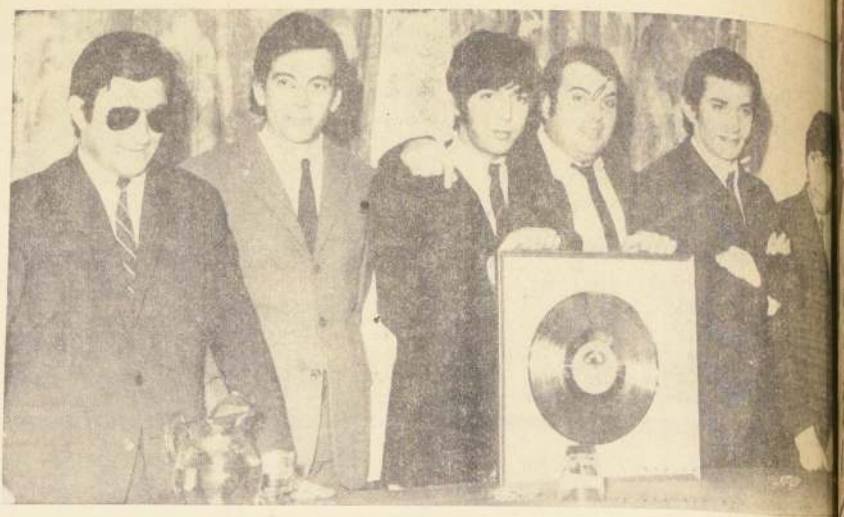
"Los Iracundos", muy formales, mientras reciben el Disco de Oro de la RCA Víctor Chilena. En el instante, en el resto de la sala se desarrollaba un fuerte incidente entre periodistas, disc-jockeys y gente de la RCA y Radio Cooperativa.