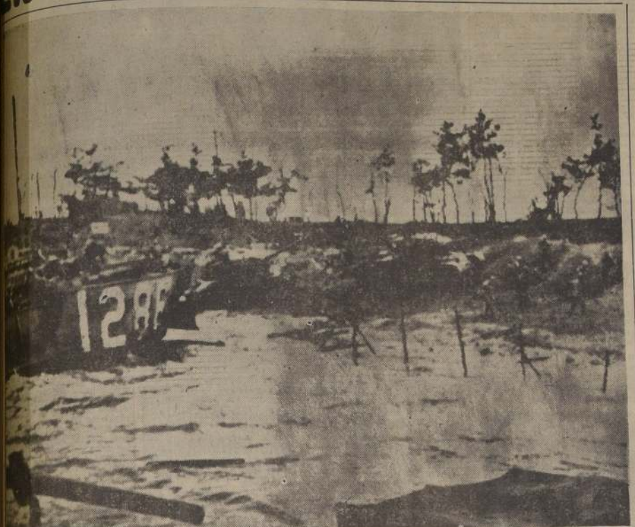
INCHON (Corea del Sur).— Infantes de Marina de los Estados Unidos, apoyados por tanques M-26, avanzan desde la orilla del mar durante su asalto y desembarco en la isla de Wolmi.