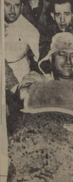
Aunque no se clasificó como el mejor volante del mundo, JUAN MANUEL FANGIO es una figura popularísima en las pistas europeas. Alfa Romeo y otras firmas comerciales se lo están disputando para las próximas competencias.

La nueva directiva comunica a todas las personas, sean varones o damas, niños o adultos que desean practicar ciclismo, se dirijan a la secretaría de la institución, para llenar la respectiva solicitud de ingreso.