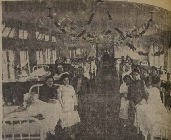
EL "18" EN LOS HOSPITALES. —La alegría del Dieciocho se proyectó también en los hospitales para mitigar el dolor y la soledad de los enfermos. En el Pabellón F del Hospital Trudeau, para Broncopulmonares, se celebró el aniversario patrio con un compartido por enfermeras y auxiliares, quienes brindaron a los pacientes una mesa con el grabado muestra las extensas salas del pabellón, profusamente adornadas con flores, banderas chilenas, escudos y flores.— Hubo números de música popular, cantos y otros actos.