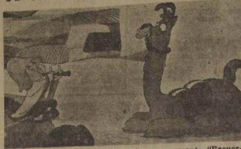
Escenas de inimitable colorido típico nos presenta "Recuerdos de Disney", que la R. K. O. Radio Pictures viene presentando desde hace una semana, con señalado éxito en el Teatro Florida.

Todo esto, en conjunto, ha formado la interesante revista que