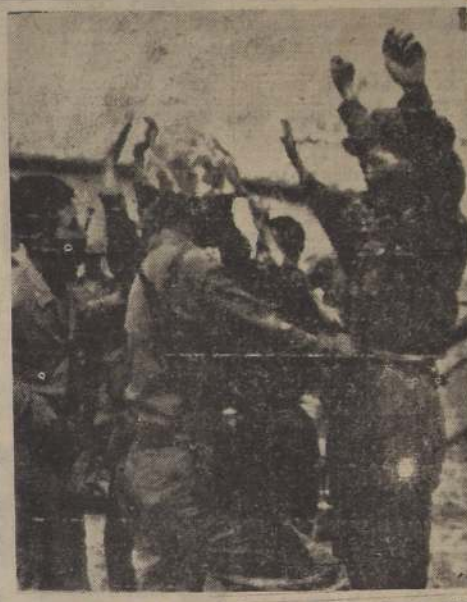
INCHON, Corea del Sur.— Tropas norteamericanas, después de desembarcar sorpresivamente en la costa de Inchon, revisan a soldados norteamericanos que tomaron prisioneros a la orilla del mar.

TOKIO, jueves, 21.— (U. P.) (Por Ralph Teatsoth).— La infantería de marina norteamericana combatió hoy a las fuerzas norteamericanas en los suburbios de Seul, en tanto que se informaba que una columna motorizada comunista de la Manchuria, se dirigía hacia la retaguardia de las fuerzas norteamericanas.