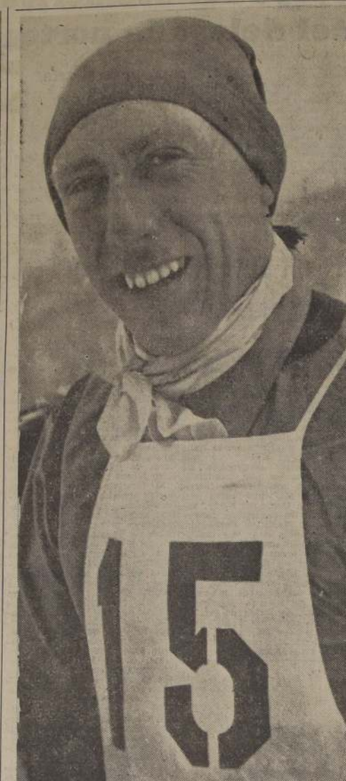
Luciendo la clásica chaquetilla del equipo de Francia, vemos a HENRI OREILLER , campeón olímpico en Saint Moritz, en 1948. En Aspen no tuvo suerte, pero siempre seguirá siendo el famoso Orellier. En atención a la política seguida hasta ahora de invitar a celebridades mundiales del esquí, no sería raro que el próximo año lo tuviéramos en Portillo, como huésped de honor.