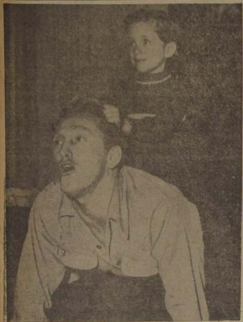
Los productores lo acosan con propuestas de contratos y él... bueno, ya lo ven, él —que es Kirk Douglas, el galán de moda— se divierte con su nene.