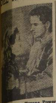
Cecil Aubrey y Tyrone Power en "La rosa negra", de la Fox.

Dietrich actúa en el film "Desesperación"