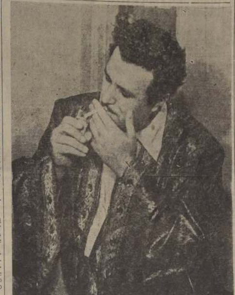
RAMON VINAY, el notable tenor chileno, que ayer llegó a esta capital para participar en la Temporada de Ópera que se desarrolla en el Teatro Municipal.

Cordial, como siempre, con la simpática que le es característica, Ramón Vinay, el gran tenor chileno, recibió a un representante de LA NACION, veinte minutos después de su llegada a Santiago. —Aquí me tiene, mi amigo. —Otra vez con ustedes, otra vez en este mi Chile maravilloso. —¿Y...? —El viaje... —Duro. Vengo desde Londres, y llevo tres noches sin dormir. —Le afectará para cantar? —¡Dios no lo quiera! Si por desgracia algún día no lo pudiera hacer como el público y yo esperamos, ojalá que no sea en mi patria... ¡No les parece...? —Repertorio...? —"Otello" y luego "Sansón y Dalila". —Nada más...? —Por desgracia, nada más. El 28 de este mes tengo que volar a San Francisco de California para cantar allí "Tristán e Isolde".