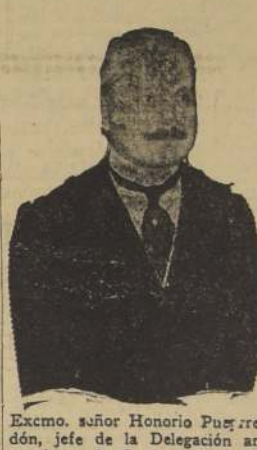
Excmo. señor Honorio Pueyrredón, jefe de la Delegación argentina a la Conferencia de La Habana, que ha solicitado la libertad de comercio

3. Se debe prohibir el tráfico de armas y municiones, salvo cuando pertenezcan a los Gobiernos mismos.