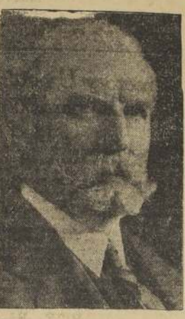
Mr. Charles E. Hughes, jefe de la Delegación de Estados Unidos, que ha propuesto la creación de zonas aéreas "prohibidas"

establecerse zonas prohibidas, por acuerdo de dos o más Estados, por razones militares o de seguridad pública.