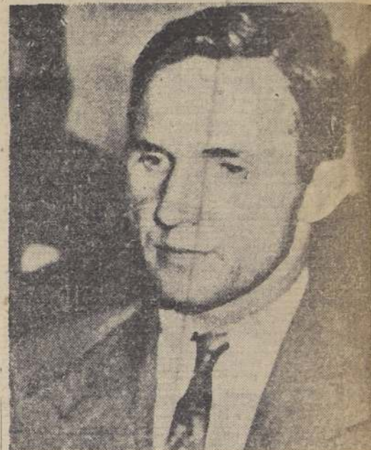
Bruno Richard Hauptmann

Al parecer, reina calma, si bien se sabe que han de surgir cuestiones que darán lugar a grandes controversias.—(U. P.)