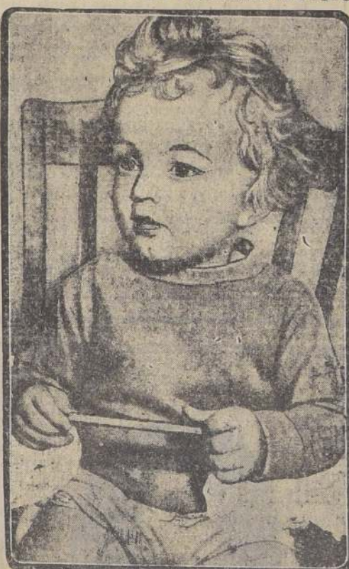
El bebé Lindbergh, o Charles Augustus junior

La voz del coronel Lindbergh podía oírse claramente en la sala.