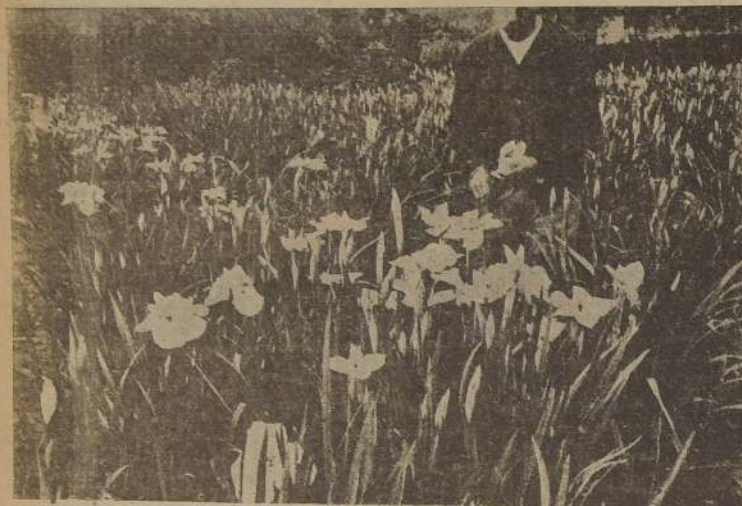
Iris cultivados para flor cortada

por el éxito. Las plantas en esta época inician ya y pronto estarán en plena floración. Algunos arbustos de flor ya terminan su época de floración y se vis-