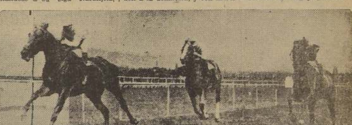
Pomulo domina a Quebrado y Kaml en la inicial

ciro tanto a Mister Lee en cuya siga se movían Lionel, que habiendo movido mal se había colocado rápidamente, Julepe Cap. Duca y Edgar Poe en tanto que Santidad y Roland eran los que cerraban la marcha.