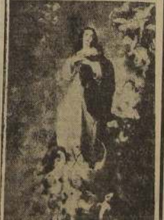
"MES DE MARIA"

Después de los bajativos de este almuerzo colosal, hay que pedir cigarrillos ovalados "Mariscal".