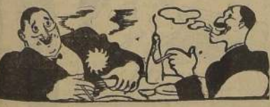
(Del folletín del "Mariscal").

PROTEJA SUS BRONQUIOS FUME Tabu 80 ctvs.