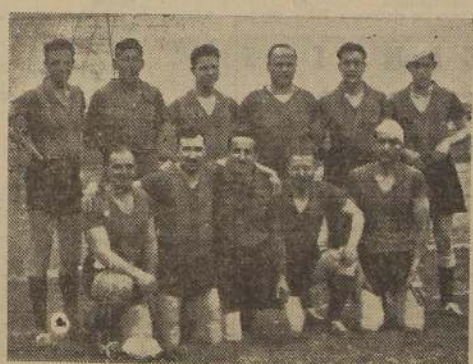
Equipo de football del Deportivo Bodegas Mir, que ocupó el primer puesto en el campeonato organizado por este club

CON UNA LUCIDA REUNION FINALIZO EL CAMPEONATO DEL CLUB BODEGAS MIR