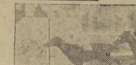
Sila, vence a Azucarada y a la favorita Bordighera en el premio Montevideo

Quinta, la gran favorita Aisé, 5 a Falencia, 6 a Arma Blanca, 7 a Onagra, 8 a Palmada y última, Rincón.