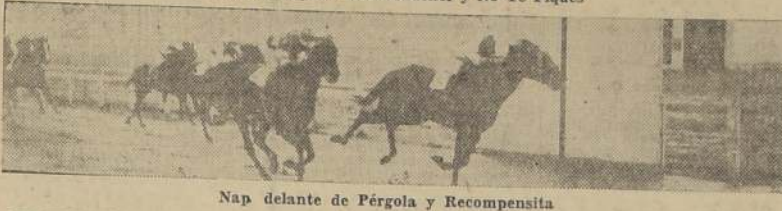
Nap delante de Pégola y Recompensa