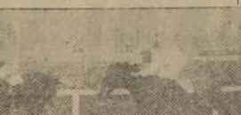
Sila, vence a Azucarada y a la favorita Bordighera en el premio Montevideo

Quinta, la gran favorita Aisé, 5 a Falencia, 6 a Arma Blanca, 7 a Onagra, 8 a Palmada y última, Rincón.