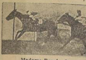
Madame Royale, da cuenta de Yastá, Gandula y Aisé, en la de potrancas perdedoras

La lluvia de ayer restó buena concurrencia a las carreras en el Club Hípico, cuyo "meet" era en honor de la República uruguaya, con motivo de la celebración de su centenario. La pista, sumamente pesada, se prestó para una sorpresa, y así pues, las pruebas de productos se resolvieron por sendos golpes, proporcionados por Miramar y por la debutante Madame Royale.