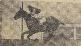
Barredor, muy fácil, delante de Nazarena, Llano Blanco y Blue Billy

Después de una pequeña movida en falso, el grupo se desechó en regulares condiciones, pues Belleville, una vez más, largó con desventaja. Ming se adelantó del puesto de peligro, y con admirable facilidad, puso tres cuerpos de ventaja sobre