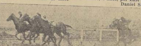
Barredor, muy fácil, delante de Nazarena, Llano Blanco y Blue Billy

Después de una pequeña movida en falso, el grupo se desechó en regulares condiciones, pues Belleville, una vez más, largó con desventaja. Ming se adelantó del puesto de peligro, y con admirable facilidad, puso tres cuerpos de ventaja sobre