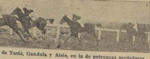
Madame Royale, da cuenta de Yastá, Gandula y Aisé, en la de potrancas perdedoras

El hijo de Last Reason, en bonito final, aventajó a Maud Victoria por tres cuartos de cuerpo.—Miramar (Rains), y Madame Royale (Marryatt), salieron de perdedores.—Barredor y Sila ganaron los handicaps de 1,300 metros, y La Razón y Gayarre las pruebas finales.—Relación y resultados generales.—Noticias diversas y próximas inscripciones.