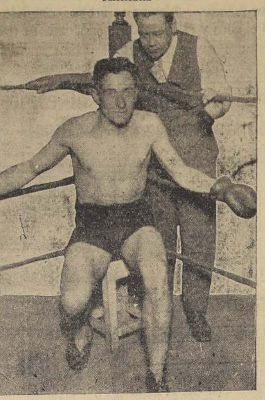
Concha, el chileno que reaparece

Ambos boxeadores rindieron una buena prueba de suficiencia