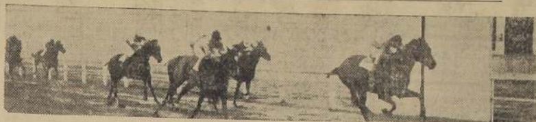
Darro se impone sobre Craker y No-Te-Piques