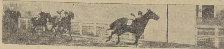
Kyra da cuenta de Más Afuera y Tesonera