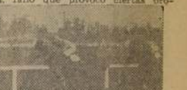
Sila, vence a Azucarada y a la favorita Bordighera en el premio Montevideo

Quinta, la gran favorita Aisé, 5 a Falencia, 6 a Arma Blanca, 7 a Onagra, 8 a Palmada y última, Rincón.