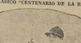
Sila, vence a Azucarada y a la favorita Bordighera en el premio Montevideo

La segunda carrera, premio General Fructuoso Rivera, también con potrancas no ganadoras, tuvo un final imprevisto, pues el triunfo