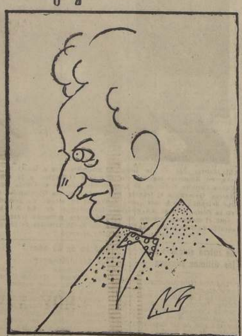
El pintor Camilo Mori, cuya exposición de óleos está obteniendo un extraordinario éxito artístico.