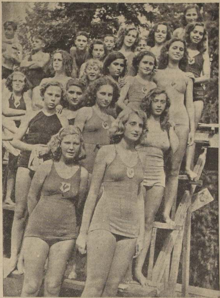
ACTUARON AYER EN LA TARDE. — Simpatico grupo de nadadoras del Stade Francais, durante el torneo interno que realizaron ayer en la tarde