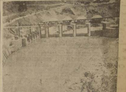
La bocatoma vista desde aguas arriba

Para realizar la primera etapa de esta obra fué necesario bajar en esta obra hasta dos mil obreros al día.