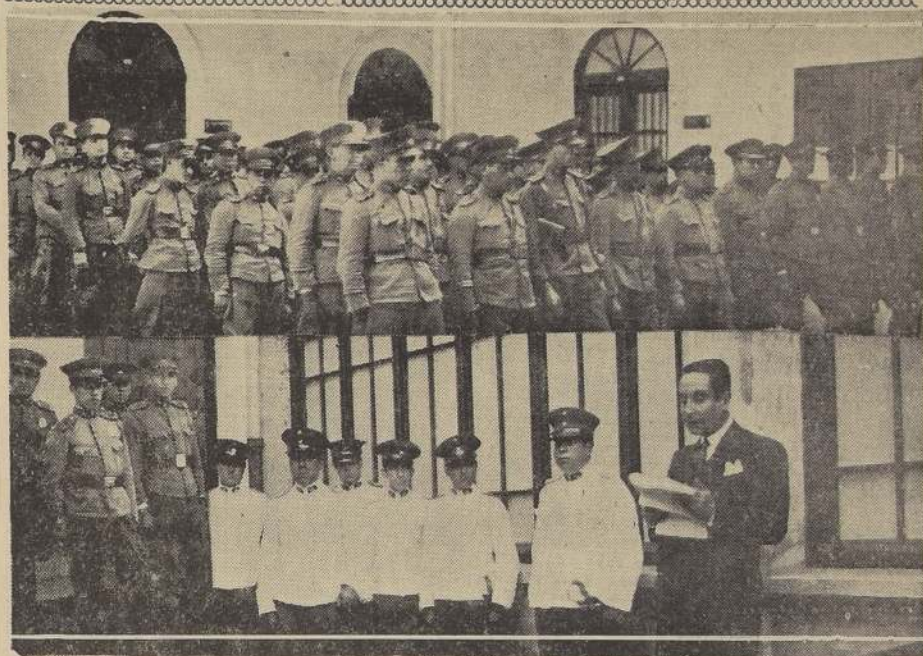
Tropa y oficialidad del Cuerpo de Carabineros presencian las conferencias de ayer