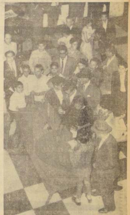
Se va acercando la hora en que termina el plazo para recibir los cupones, y la gente se apura en depositarlos. El popular Concurso "VIVA GRATIS UN MES", ha sido un éxito extraordinario, con plena aceptación entre los lectores de LA NACION y público en general, tanto de la capital como de provincia. El grabado muestra el buzón gigante en el hall de nuestro diario.