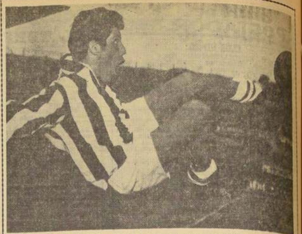
OMAR SIVORI, interior izquierdo de Juventus, que se mostró irascible en el combate ante Real Madrid. Momentos antes de comenzar el partido, lo observaron un momento de oro, reconociéndolo como el futbolista N.º 1 de Europa, en la temporada 1960-1961.