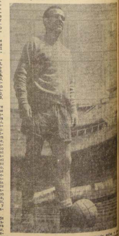
DI STEFANO.— No hay caso, sigue haciendo gala de su finiendo partidos a favor de Real Madrid. El argentino hizo el 1-0 sobre Juventus, en partido que valía para la VII Copa de Europa.