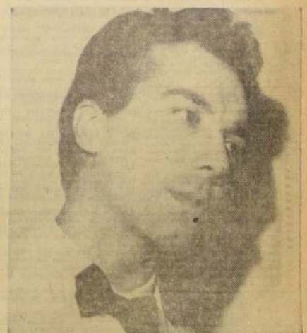
JORGE SOBRAL, cantante argentino de tangos y de folclor, y artista cinematográfico, se presenta en Radio Minería, Teatro Carola y Waldorf. (Actuará acompañado por las guitarras de Flores, Lorea y Lucero).