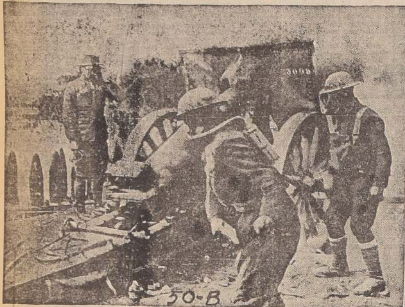
Artillería norteamericana en plena acción. Obsérvense las máscaras que llevan los soldados para protegerse de los gases asfixiantes

Como la situación de las fuerzas aliadas no parecía del todo segura, habíamos llegado al instante de preparar y formar nuestro propio ejército en las inmediaciones de Chateau Thierry, para preparar el movimiento ofensivo tan pronto como el futuro para los aliados había cambiado completamente des-