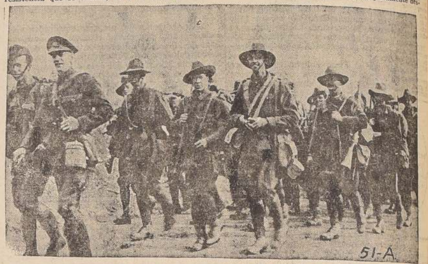
Combatientes australianos. El día 4 de julio de 1918, sólo quedaba un grupo pequeño de estos bravos soldados que tanto se distinguieron en el Frente Occidental

El espíritu del pueblo francés en esta ocasión se había elevado a niveles superiores. Con frecuencia las palabras "Liberté, Fraternité, Egalité", no son más que ecos sonoros, que no logran inspirar los sentimientos. En esta ocasión, sin embargo, al ser pronunciadas por un pueblo que luchaba desesperadamente entre