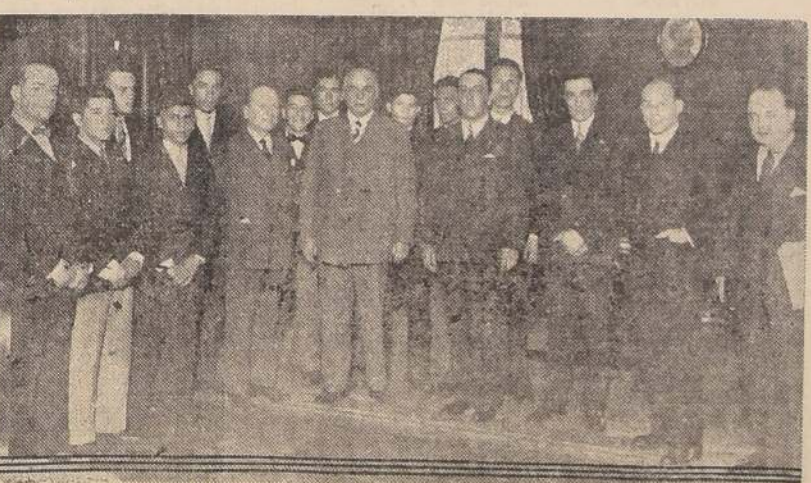
La delegación chilena en su visita al Presidente del Uruguay

En la última vuelta, las acciones se hicieron más violentas, pero Acevedo siguió empeñado en no modificar su sistema de pelea, ofreciendo al uruguayo, quien dirigió con éxito golpes con ambas manos al cuerpo y cabeza del chileno. Terminó el combate con la victoria de Olivera, que reputamos justa, aun cuando al chileno hubiera hecho las cosas bien, el resultado habría sido totalmente distinto.