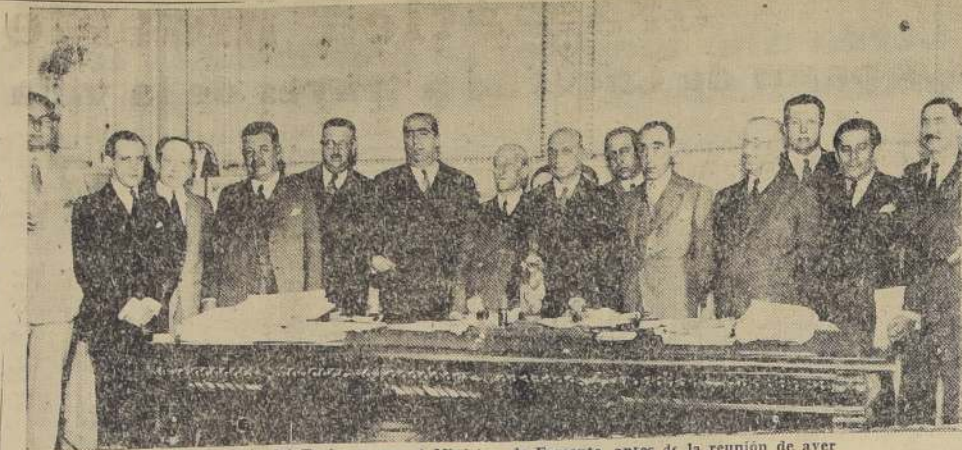
El Consejo del Turismo, con el Ministro de Fomento, antes de la reunión de ayer