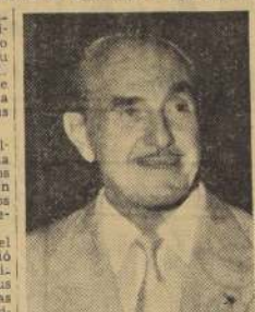
Tercera semana inicia la cinta del Windsor

El nuevo presidente, recién elegido, altamente optimista de su Compañía y del futuro de la industria, afirmó que "estoy muy contento que mis hermanos, el Directorio y el distinguido grupo financiero hayan colocado bajo mi dirección la continuidad de la Compañía iniciada por nuestra familia. En nombre de mis hermanos y el mío propio, quiero agradecer a nuestros empleados y accionistas, como asimismo a nuestros amigos y asociados de todas partes, que han demostrado su lealtad y dedicación a la Compañía a través de los años. Deseo asegurarme que nosotros — y esto quiere decir ellos — tenemos mayor confianza en los negocios y estamos más orgullosos que nunca."