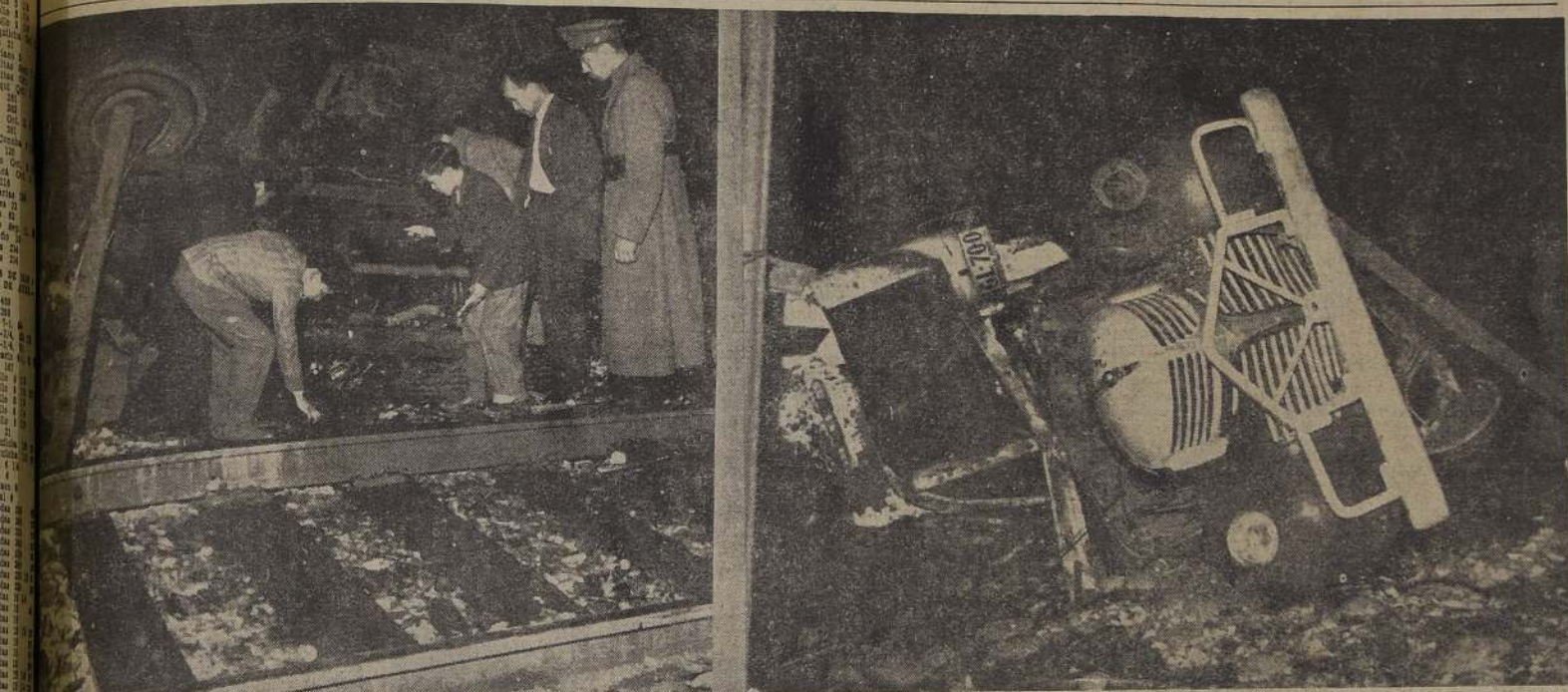
EL ACCIDENTE DE RENGO.— La vía férrea, sobre la cual fué arrastrada a lo largo de 150 metros, como un vulgar muñeco, el enorme microbús Dodge. Al fondo, grupos de carabi- nerías de Ferrocarriles rodean la calcinada máquina. Nueve eran hasta la madrugada de hoy los muertos del accidente, y muchos otros heridos yacen agonizantes en el Hospital Regional de Rengo. En otra fotografía alcanza a distinguirse el destrozado micro en un primer plano. Sólo fierros retorcidos quedaron de la máquina.

EL ACCIDENTE SE REGISTRO AYER A LAS 18.45 HRS. AL LLEGAR A RENGO