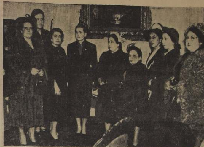
HOMENAJE A SU LABOR SOCIAL. — Las señoras que aparecen rodeando a la esposa de S. E. el Presidente de la República, señora Rosa Markmann de González Videla, la visitaron ayer para hacerle entrega de un telegrama en nombre de las Girls Guides de Chile. Le expresaron que habían querido así dejar constancia del homenaje de esta institución a la magnífica labor social de la Primera Dama de la República, en vísperas del día de su onomástico.