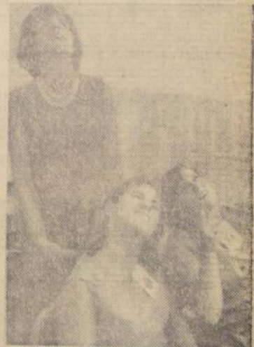
La familia Cooper mira el desplazamiento de la nave espacial donde va el jefe del hogar. La esposa y las hijas han seguido la ruta de Gordon, el comandante piloto de la Geminis-V, con ansiedad.