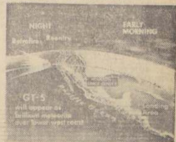
La Geminis-V se desplaza a gran velocidad en el espacio, semejando un meteorito, como puede apreciarse en el grabado. La astronave cumple hoy siete días de "ruta" espacial y entra al octavo, superando con creces el record soviético, que era de cinco días.