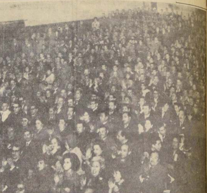
A teatro lleno se han realizado las tres sesiones plenarias que lleva hasta el momento el IV Congreso CUT. Las delegaciones han demostrado gran interés por asistir al torneo que organiza la Central Única de Trabajadores y el cual finaliza hoy. EN EL GRABADO, un aspecto de la concurrencia durante una de las sesiones efectuadas en el Teatro Portugal.