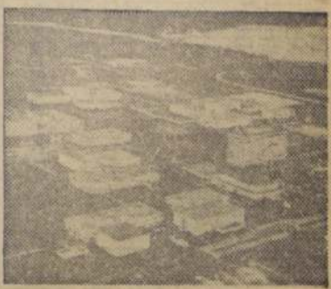
Esta es el Centro para Vuelos Espaciales Piloteados de la Administración Nacional de Aeronáutica y del Espacio (NASA), en Houston. En el centro se controlan el estado físico de los astronautas y el funcionamiento de la nave.