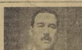
Director General de Agricultura