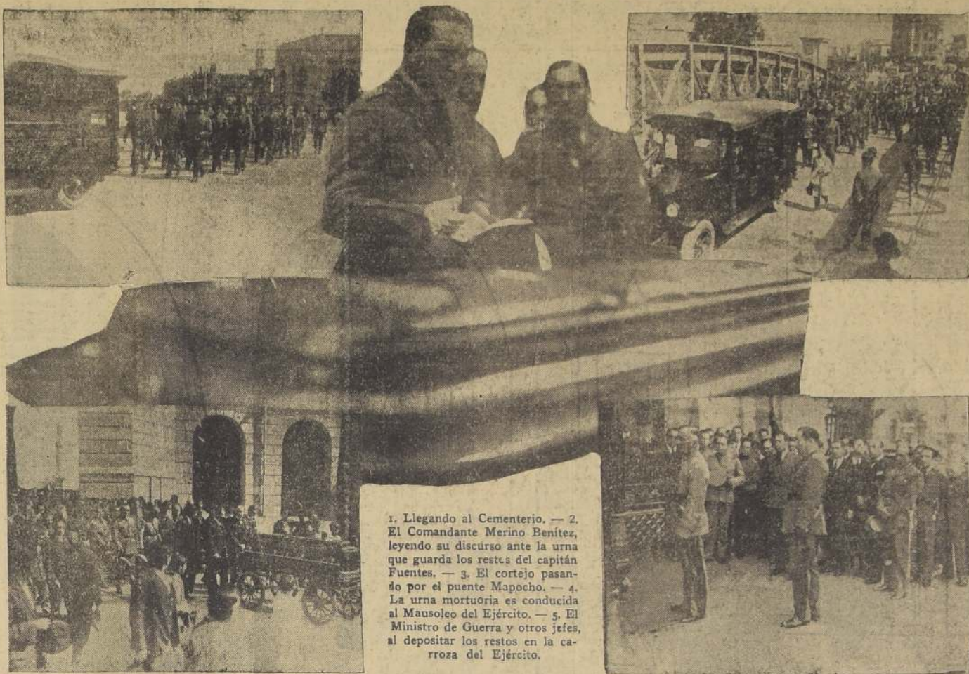
1. Llegando al Cementerio. — 2. El Comandante Merino Benítez, leyendo su discurso ante la urna que guarda los restos del capitán Fuentes. — 3. El cortejo pasando por el puente Mapocho. — 4. La urna mortuoria es conducida al Mausoleo del Ejército. — 5. El Ministro de Guerra y otros jefes, al depositar los restos en la carroza del Ejército.

La demanda de adhesión a este torneo debe ser dirigida a Mr. Ove Tryde (3 Østergade, Copenhague K, Dinamarca).