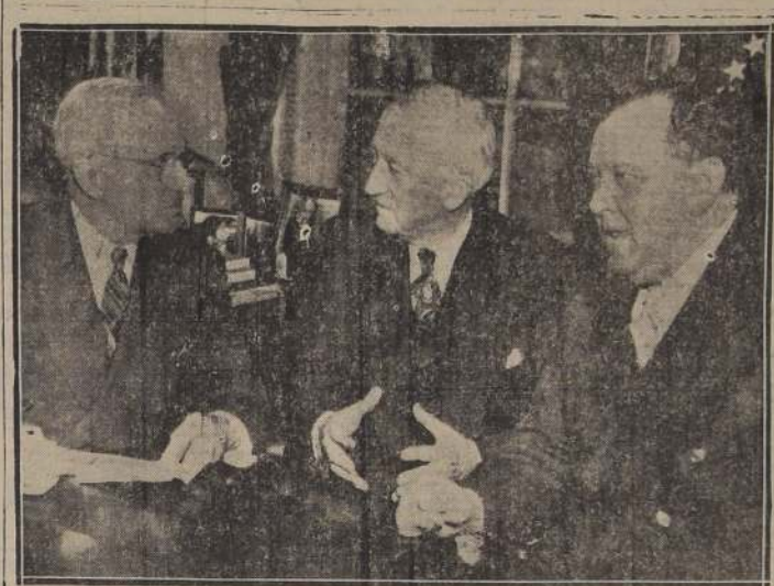
El Secretario General de Organización de las Naciones Unidas, señor Trygve Lie, conferencia con el Presidente Truman y con el Secretario de Estado Byrnes en la Casa Blanca.