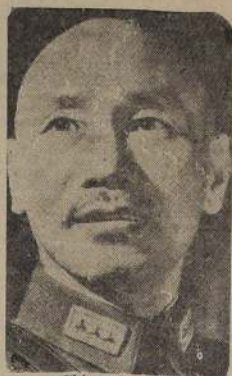
Chiang Kai Shek

Declaró ayer Chiang Kai Shek. Las relaciones con Rusia. — Siguen las discusiones con el Partido Comunista