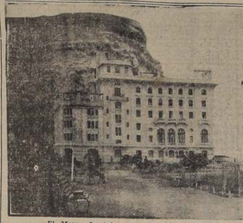
El Morro de Arica y el Hotel Pacifico.

La declaración de Truman, que se refiere a la guerra a la Alemania nazi, es una declaración de guerra a la Alemania nazi, y no a la Alemania nazi.