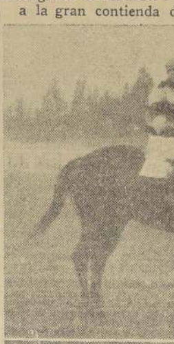
Vitellio que baja tras una rehabilitación bien probable.

Aquí dirimirán superlucidas campeonas que aun no han tenido oportunidad de hacerlo, y como el vencedor debe, de hecho, considerarse como el crack de la generación, se comprenderá