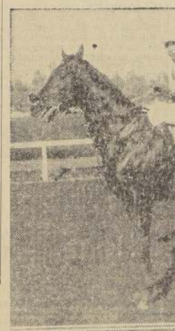
Gran Emir, el casi invicto hijo de Salpicón, que al parecer será el favorito

Vitellio ha visto decaer sus bonos últimamente por la derrota que sufrió al ser batido por Sahri y Koenigsmark en una prueba condicional, pero estamos seguros que ahora el pequeño hijo de Henry Lee mejorará en mucho, pues reaparece en condiciones de training muy